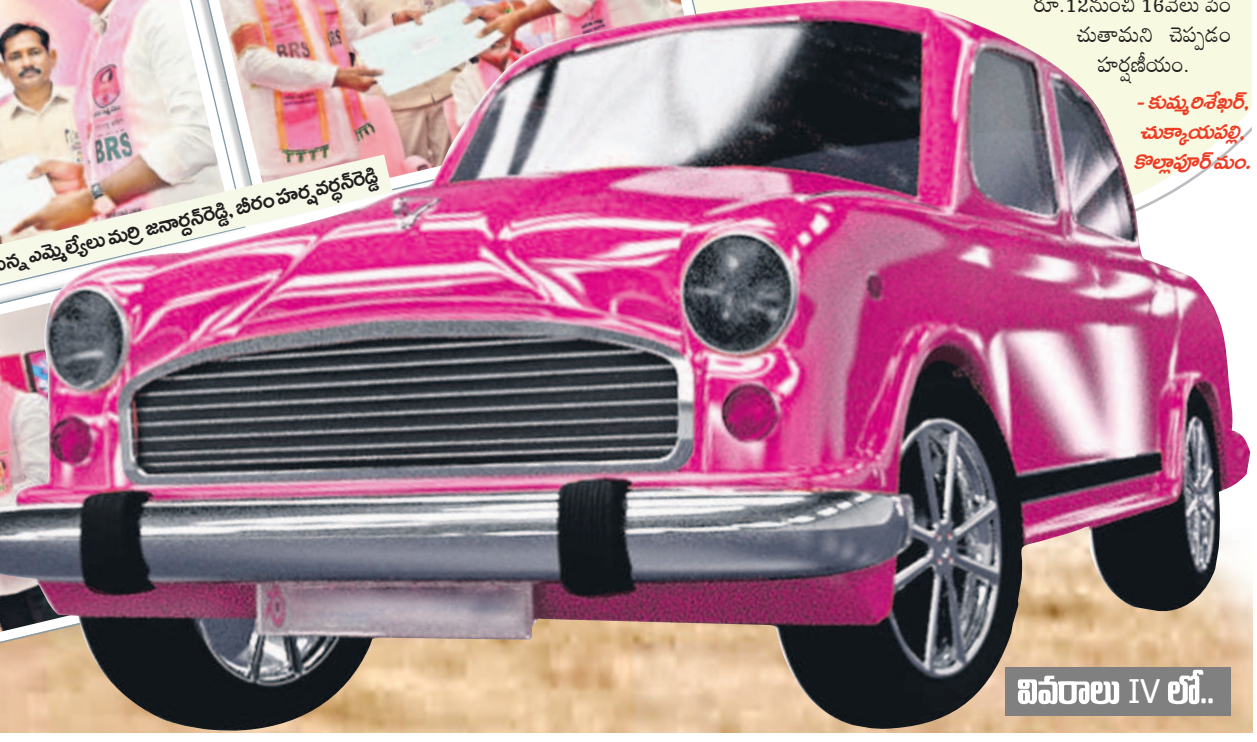
ఐవరాలు IV లో..