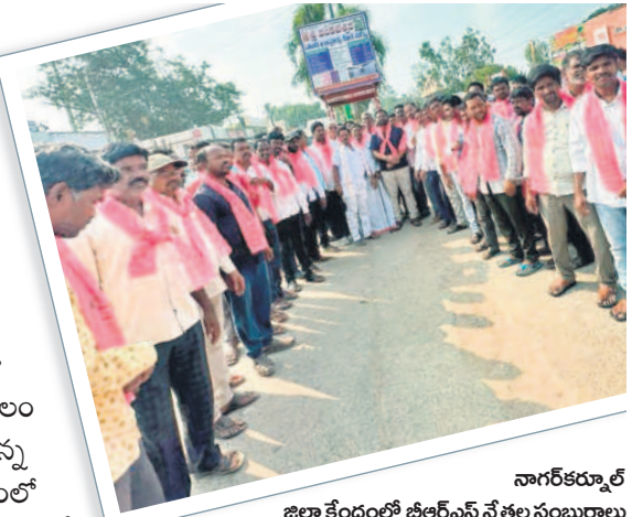
నాగర్ కర్నూల్ జిల్లా కేంద్రంలో బీఆర్ఎస్ నేతల సంబురాలు

బీఆర్ఎస్ పార్టీ అధినేత, సీఎం కేసీఆర్ ఆదివారం ఎన్నికల మ్యానిఫెస్టో ప్రకటించారు. అందులో సంక్షేమానికి, పేదలకు అధిక ప్రాధాన్యతనిచ్చారు. రోజువారీ జనావసరల్లో భాగమయ్యేలా రూపొందించిన మ్యానిఫెస్టో ప్రతిపక్షాలకు మైండ్ బ్లాంక్ అయ్యింది. ప్రజలు, దివ్యాంగులకు ఆర్థిక భరోసా కల్పించే ఆసరా పింఛన్ ను గణనీయంగా పెంచడం విశేషం. రేషన్ కార్డు లబ్ధిదారులందరికీ సన్నబియ్యం అందించేందుకు 'అన్నపూర్ణ'ను ప్రవేశపెట్టారు. దేశంలో ఏ రాష్ట్రంలో లేని, ఏ పార్టీ ప్రవేశపెట్టని విధంగా ప్రజలందరికీ లబ్ధి చేకూరేలా ఈ పథకానికి శ్రీకారం చుట్టారు. 'కేసీఆర్ బీమా.. ప్రతి కుటుంబానికి ధీమా'తో రాష్ట్ర వ్యాప్తంగా 93 లక్షల కుటుంబాలకు లబ్ధి కలుగునున్నది. ఈ పథకం కింద కుటుంబంలో ప్రతిఒక్కరికీ రూ.5లక్షల బీమా సదుపాయం కల్పించింది. రైతుబంధు సాయాన్ని అధికారంలోకి వచ్చిన మొదటి ఏడాది రూ.12 వేలకు చేయనున్నది. వచ్చే ఐదేండ్లనాటికి రూ.16వేలకు చేరనున్నది. పేదలు, జర్నలిస్టులకు రూ.400