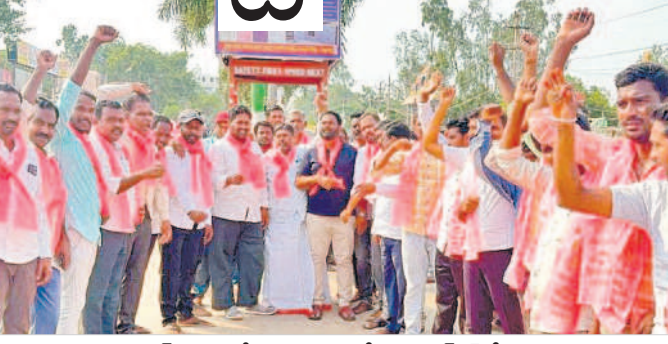
నాగర్ కర్నూల్ లో హార్వం వ్యక్తం చేస్తున్న బీఆర్ఎస్ శ్రేణులు

నాగర్ కర్నూల్/వనపర్తి, అక్టోబర్ 15 (నమస్తే తెలంగాణ) : బీఆర్ఎస్ మ్యానిఫెస్టో.. ప్రతిపక్షాల మైండ్ బ్లాంక్ య్యేలా చేసింది. పేదల సంక్షేమం, రోజువారీ జనావసరాలలో భాగమయ్యేలా రూపొందించిన బీఆర్ఎస్ మ్యానిఫెస్టో సీఎం కేసీఆర్ ప్రకటించడంతోనే గ్రామస్థాయిలోనూ ప్రజల మదిలోకి చొచ్చుకెళ్లింది. బీఆర్ఎస్ అభ్యర్థులకు తొలివిడతగా బీఫారాలను అందించడంతోపాటుగా వెల్లడించిన ఎన్నికల ప్రణాళికతో ఉమ్మడి జిల్లా వ్యాప్తంగా బీఆర్ఎస్ శ్రేణుల్లో హద్దం వ్యక్తం కాగా ప్రజలు సైతం సానుకూలత వ్యక్తం చేస్తున్నారు. పేదలపై సీఎం కేసీఆర్ కు ఉన్న చిత్తశుద్ధికి ఈ మ్యానిఫెస్టో అద్దంపడుతుందనే అభిప్రాయాలు అన్ని వర్గాల నుంచి వ్యక్తమవుతున్నది. పేదల మ్యానిఫెస్టో.. సీఎం, బీఆర్ఎస్ అధినేత కేసీఆర్ ప్రకటించిన 2023 అసెంబ్లీ ఎన్నికల మ్యానిఫెస్టో ప్రజలను ఎంతగానో ఆకట్టుకొంది. పేదల సంక్షేమమే లక్ష్యంగా రూపొందించడంపై ప్రజలతోపాటుగా మేధావుల్లోనూ చర్చనీయాంశంగా మారింది. తెలంగాణ ఏర్పడినప్పటి నుంచి పేదరికం దూరం చేసే పేదల ఆర్థిక జీవితాల్లో మార్పు తీసుకురావడమే లక్ష్యంగా సీఎం కేసీఆర్ పథకాలను అమలు చేస్తూ వస్తున్నారు. ఈ క్రమంలో రాబోయే అసెంబ్లీ ఎన్నికల్లోనూ పేదల సంక్షేమానికే ప్రాధాన్యత ఇస్తూ మ్యానిఫెస్టోను ప్రకటించడం విశేషం. ముఖ్యంగా పేదలకు ఆర్థిక భరోసా కల్పించే ఆసరా పంచన రూ.2,016 నుంచి రూ.6,016కు పెంచడం విశేషం. ఈ ఎన్నికల్లో అధికారంలోకి వచ్చిన మొదటి ఏడాది రూ.2,016 ఆసరా పంచన రూ.3,016 కు పెంచడం జరుగుతుంది. ఆ తర్వాత వచ్చే ఐదేండ్లలో రూ.5,106కు చేరు