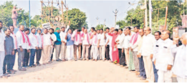
తాసె: సంబురాలలో పాల్గొన్న బీఆర్ఎస్ నాయకులు, కార్యకర్తలు