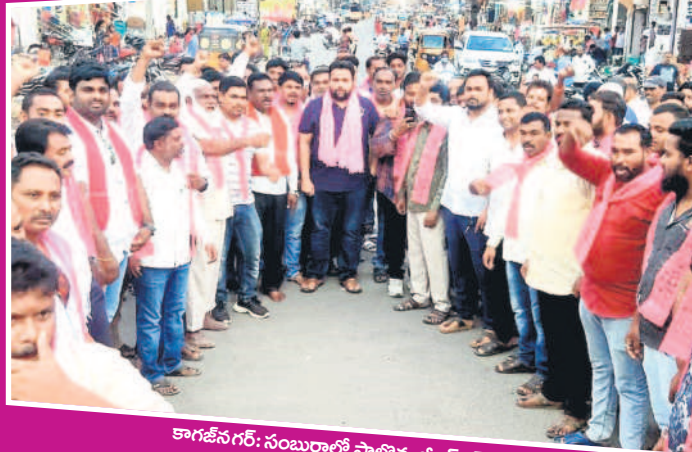
కాగజేనగర్: సంబురాలలో పాల్గొన్న బీఆర్ఎస్ శ్రేణులు