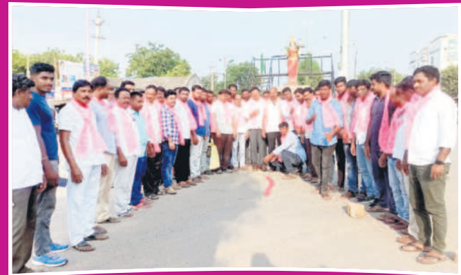
చెన్నూర్లో పటాకులు కార్మి సంబురాలు నిర్వహిస్తున్న చెన్నూర్, ఆస్సాద్ మండలాల నాయకులు