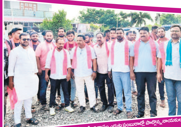
అసిఫాబాద్ టౌన్: అసిఫాబాద్లో కోవలక్ష్మి నివాసం ఎదుట సంబురాలలో పాల్గొన్న నాయకులు