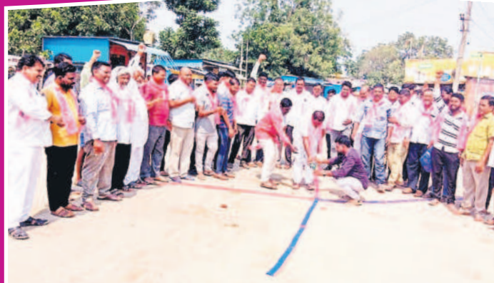
బాసర్: రైల్వే స్టేషన్ ఎదుట పటాకులు కార్మి సంబురాలు చేస్తున్న బీఆర్ఎస్ నాయకులు