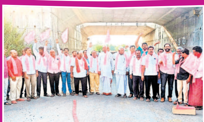
జైసల్: భోరజీలో సంబురాలలో పాల్గొన్న ప్రజాప్రతినిధులు, నాయకులు