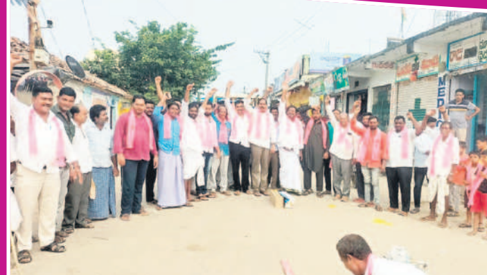
లక్ష్మణాచారం: పటాకులు కార్మి సంబురాలు చేస్తున్న బీఆర్ఎస్ నాయకులు