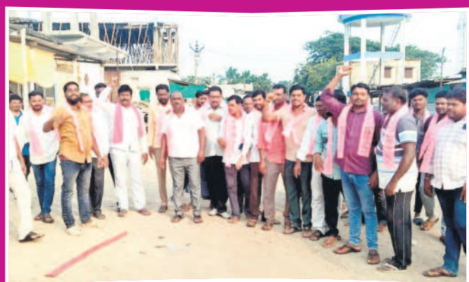
నెన్నెల: నెన్నెలలో సంబురాలలో పాల్గొన్న బీఆర్ఎస్ నాయకులు