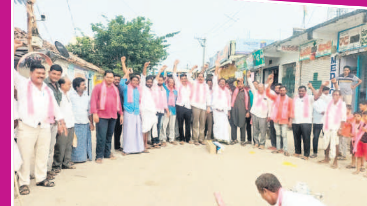
లక్ష్మణాచారం: పటాకులు కారుస్తున్న జీఆర్ఎస్ నాయకులు