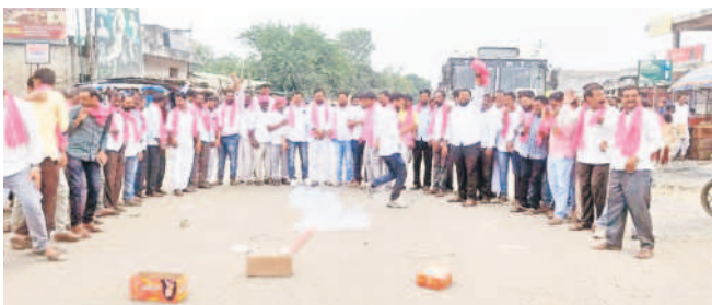
ఇచ్చోడ: పటాకులు కారుస్తున్న ప్రజాప్రతినిధులు, నాయకులు