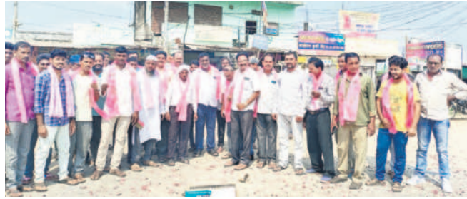
సిర్సూర్(టీ): మండల కేంద్రంలో పటాకులు కారుతున్న నాయకులు