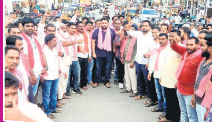
కాగజేనగర్: సంబురాలి పాల్గొన్న జీఆర్ఎస్ శ్రేణులు