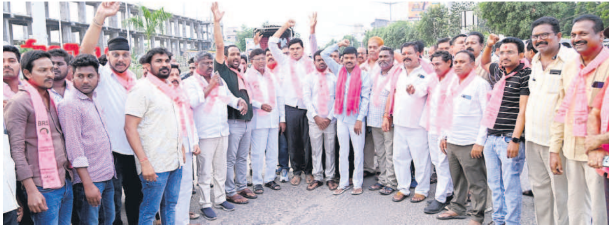
మంచిర్యాల ఐటిలో నివాదాలు చేస్తున్న నాయకులు