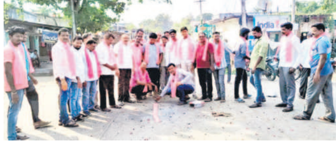
కాసిపేట: కాసిపేటలో సంబురాలి పాల్గొన్న నాయకులు