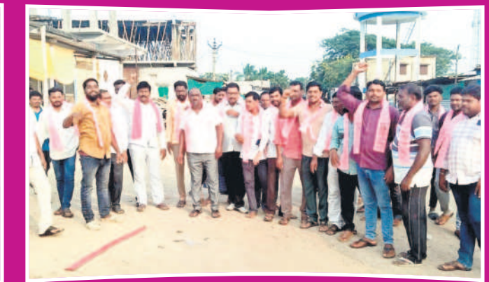
నెన్నెల: నెన్నెలలో సంబురాలి పాల్గొన్న జీఆర్ఎస్ నాయకులు