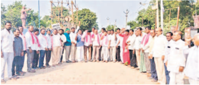
తాసి: సంబురాలి పాల్గొన్న జీఆర్ఎస్ నాయకులు, కార్యకర్తలు