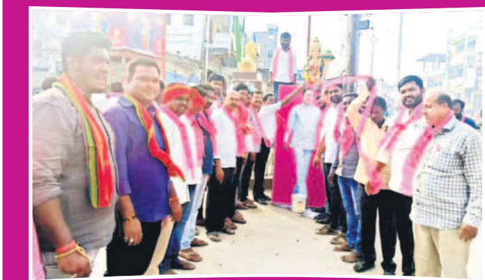
ఖానాపూర్: సీఎం కేసీఆర్ ప్లెక్సీకి పాలాబిక్సకం చేస్తున్న జీఆర్ఎస్ నాయకులు