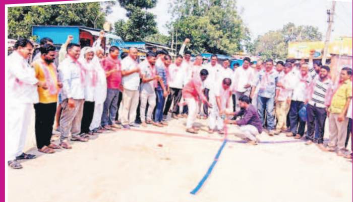
బాసర్: రైల్వేస్టేషన్ ఎదుట పటాకులు కారుస్తున్న జీఆర్ఎస్ నాయకులు