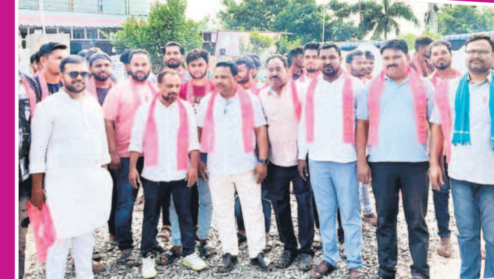
ఆసిఫాబాద్ టౌన్: ఆసిఫాబాద్లో కోవలక్ష్మి నివాసం ఎదుట సంబురాలి పాల్గొన్న నాయకులు