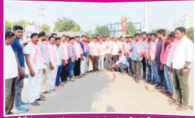
చెన్నూర్లో పటాకులు కార్మి సంబురాలు నిర్వహిస్తున్న చెన్నూర్, ఆస్సాద్ మండలాల నాయకులు