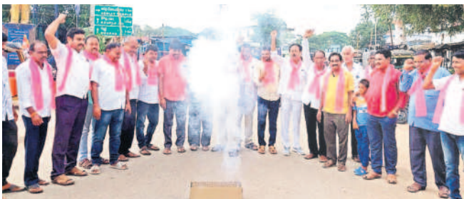
సారంగాపూర్: పటాకులు కారుస్తున్న ప్రజాప్రతినిధులు, నాయకులు