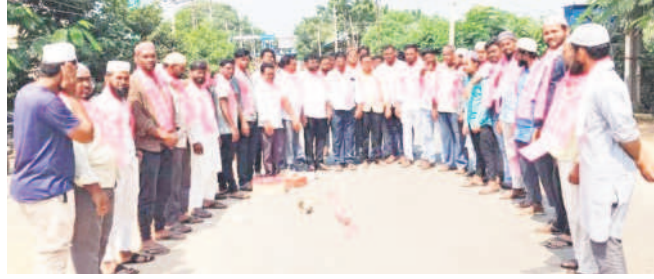
దిలావర్పూర్: సంబురాలి పాల్గొన్న జీఆర్ఎస్ నాయకులు