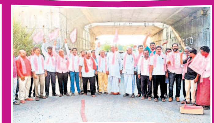
జైసల్: భోరజీలో సంబురాలి పాల్గొన్న ప్రజాప్రతినిధులు, నాయకులు