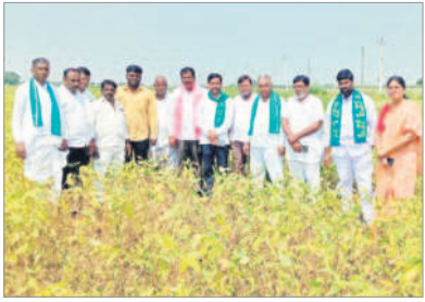
స్థలాన్ని పరిశీలిస్తున్న బీఆర్ఎస్ నాయకులు