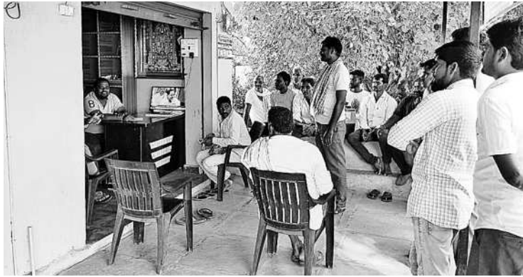
న్యాయాధికారి: డప్పురలో సీఎం కేసీఆర్ మేనిఫెస్టోను బీబీలో వీక్షిస్తున్న బీఆర్ఎస్ నేతలు, ప్రజలు

జిల్లాలో 2,08,503 మంది రైతులకు రైతు బీమా పథకం వర్తిస్తున్నది. తాజాగా సీఎం కేసీఆర్ అన్నివర్గాల వారి కోసం కేసీఆర్ బీమా పథకం