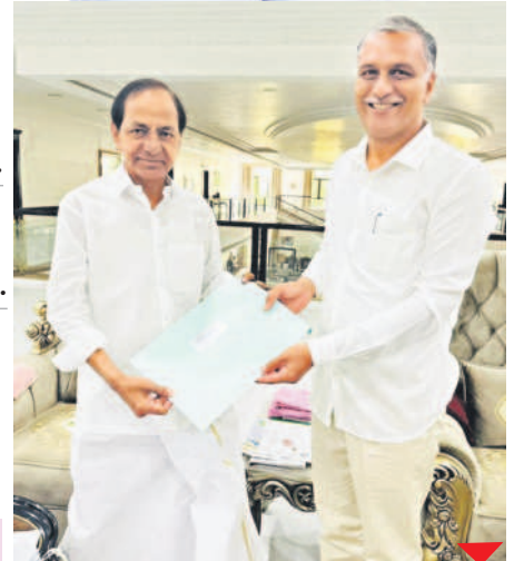
సిద్దిపేట బీఆర్ఎస్ అభ్యర్థిగా పోటీ చేస్తున్న రాష్ట్ర మంత్రి హరీశ్ రావు ఆదివారం హైదరాబాద్ లోని ప్రగతి భవన్ లో అధినేత కేసీఆర్ నుంచి బీఫాం అందుకుంటున్న దృశ్యం...