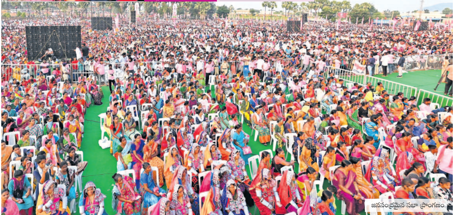
జనసంద్రమైన సభా ప్రాంగణం

- సిద్దిపేట ప్రతినిధి (నమస్తే తెలంగాణ) /హుస్సాబాద్, అక్టోబర్ 15