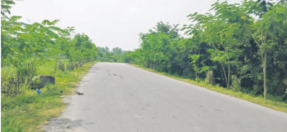
బొంరాన్పేట రోడ్డుకు ఇరువైపులా పెరిగిన చెట్లు

బొంరాన్పేట, అక్టోబర్ 15: అడవుల పెంపుడలే లక్ష్యంగా ప్రభుత్వం చేపట్టిన తెలంగాణకు హరితహారం కార్యక్రమం నుంచి ఫలితాలు ఇస్తున్నది. ఏడు విడుతలుగా చేపట్టిన హరితహారం కార్యక్రమంలో ప్రజలు, అధికారులు, ప్రజా ప్రతినిధులు భాగస్వాములై మండలంలో విరివిగా మొక్కలు నాటారు. ప్రభుత్వ కార్యాలయాలు, పాఠశాలలు, ఇండ్ల ముందు, ఖాళీ స్థలాలు, పొలం గట్టపైన, అటవీ ప్రాంతాల్లో, వైకుంఠ ధామాల్లో, పల్లె ప్రకృతి వనాల్లో వివిధ రకాల మొక్కలు నాటారు. అధికారులు అవెన్యూ ప్లాంటేషన్ పై దృష్టి సారించి మొక్కలు నాటగా, అవి ఏపుగా పెరిగి ప్రయాణికులకు ఆహ్లాదాన్ని అందిస్తున్నాయి. మండలంలోని మెట్టకుంట్ల నుంచి రేగడిమైలారం వరకు హైదరాబాద్-బీజాపూర్ రహదారికి ఇరువైపులా 15 కిలో మీటర్లు రోడ్డుకు ఇరువైపులా ఆరువేల మొక్కలు నాటారు. అదేవి