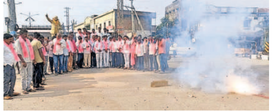
పటాకులు కాలుస్తున్న బీఆర్ఎస్ శ్రేణులు..