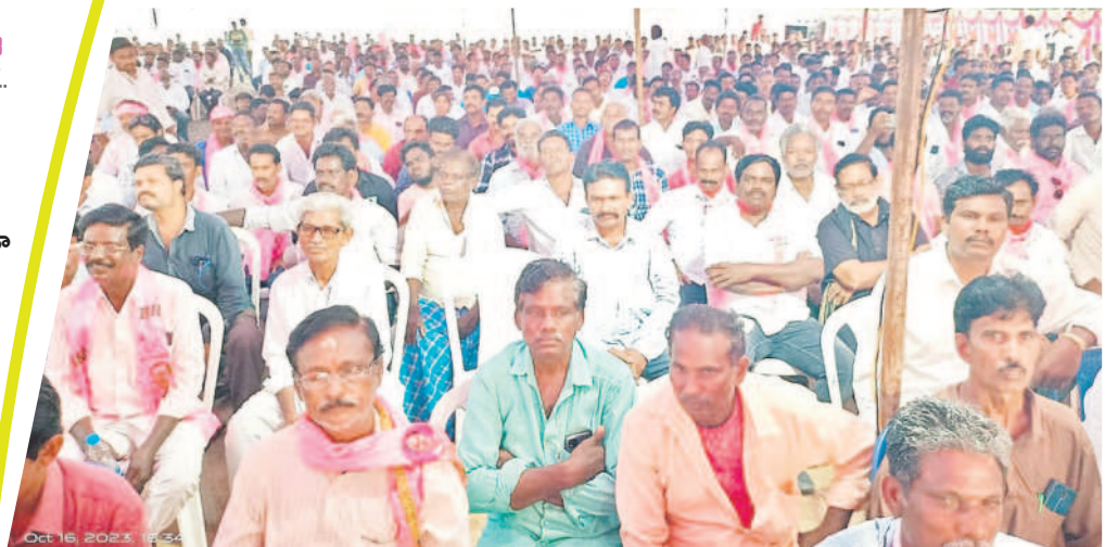
సమావేశానికి హాజరైన బీఆర్ఎస్ నాయకులు, కార్యకర్తలు, ప్రజలు