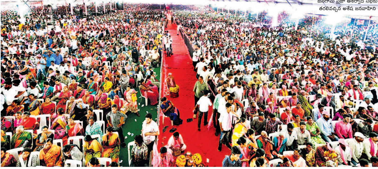
జనగామ ప్రజా ఆశీర్వాద సభకు తరలివచ్చిన అనేక జనవాసిని