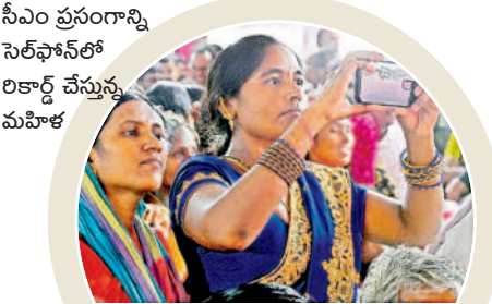
సీఎం ప్రసంగాన్ని సెల్ ఫోన్ లో రికార్డ్ చేస్తున్న మహిళ