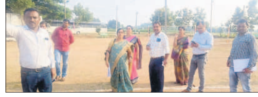
క్రీడా పోటీలకు ఏర్పాటు చేస్తున్న ఫిజికల్ డైరెక్టర్లు, ఏడీఆర్