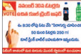
సోషల్ మీడియాలో వైరల్ అవుతున్న ఫోటో

జగిత్యాల టౌన్, అక్టోబర్ 16: ఓటు వేయండి.. కూల్ డ్రింక్ తాగండి.. ఎవరైతే ఉదయం పూట ఓటు వేస్తారో వారికి కూల్ డ్రింక్ ఇస్తామని ఓ స్వచ్ఛంద సంస్థ సోషల్ మీడియాలో