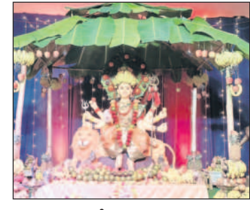
పండ్ల అలంకరణలో అమ్మవారు