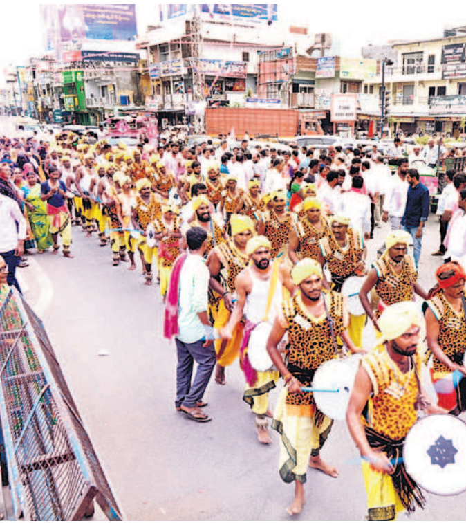
డప్పుచప్పులతో ర్యాలీగా వస్తున్న కళాకారులు

600మందితో భారీ బందోబస్తు.. వరంగల్ సీపీ అంబర్ కిశోర్ రూూ నేతృత్వంలో సభకు 600మంది పోలీసులతో భారీ బందోబస్తు కల్పించారు. వెస్ట్కోస్ డిసీపీ పీ సీతారాం, ఆరుగురు ఏసీపీలు హెలిప్యాక్, సభా ప్రాంగణం, సభా వేదిక, వీఐపీ, మీడియా గ్యాలరీ, పార్కింగ్ ప్రాంతాల్లో భద్రత కల్పించారు. 14 మంది సీబలు, 34 మంది ఎస్ఐలు, ఏఎస్సీలు, హెడ్ కాన్స్టేబుల్స్, కానిస్టేబుల్స్, హోంగార్డులు కట్టుదిట్టంగా విధులు నిర్వహించారు.