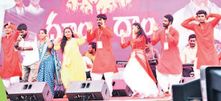
వేదికపై ఆటపాటలతో హోరెత్తిస్తున్న కళాకారులు

ఆగం కావొద్దు.. ఆలోచనతో ఓటియాలై.. 'ఓటు అనేది ప్రజల తలరాతను, తెలంగాణ భవిష్యత్తును ప్రభావితం చేస్తుంది. ఎన్నికలు రాగానే ఆగమాగం కాకుండా స్పష్టమైన అవగాహనతో ప్రజలు ఆలోచనతో ఓటియాలై' అని సీఎం కేసీఆర్ సూచించారు. జనగామ ప్రజా ఆశీర్వాద సభ వేదికగా ఎన్నికల శంఖారావాన్ని పూరించిన ఆయన, తెలంగాణలో తొమ్మిదేండ్లలో జరిగిన అభివృద్ధిని కళ్లగట్టారు.