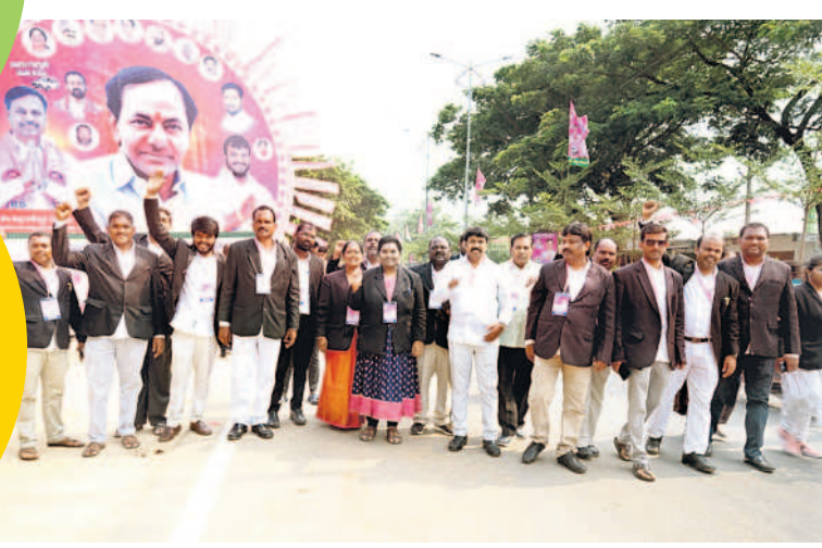
జనగామ బీఆర్ఎస్ అభ్యర్థి పల్లాకు మద్దతుగా ర్యాలీ తీస్తున్న సభకు వస్తున్న న్యాయవారులు