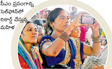
సీఎం ప్రసంగాన్ని సెల్ఫోన్లో రికార్డ్ చేస్తున్న మహిళ

గులాబీల జెండాల్ రామక్క... జనగామ గడ్డ పల్లా అడ్డ.. 'గులాబీల జెండాల్ రామక్క.. గుర్తుల గుర్తులమకో రామక్క' 'జనగామ గడ్డ.. పల్లా అడ్డ.. పల్లాకు అడ్డెవడు' అనే పాటలు సభలో మార్మోగాయి. కళాకారులు ఈ పాటలు పాడుతుంటే సభికుల నుంచి మంచి స్పందన వచ్చింది.