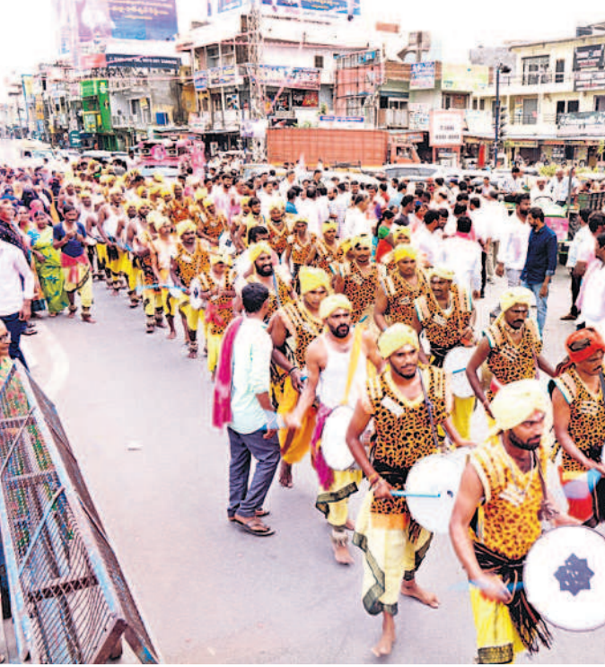
డప్పుచప్పులతో ర్యాలీగా వస్తున్న కళాకారులు

600మందితో భారీ బందోబస్తు.. వరంగల్ సీపీ అంబర్ కిశోర్ రూూ నేతృత్వంలో సభకు 600మంది పోలీసులతో భారీ బందోబస్తు కల్పించారు. వెస్ట్కోస్ డిసీపీ పీ సీతారాం, ఆరుగురు ఏసీపీలు హెలిప్యాక్, సభా ప్రాంగణం, సభా వేదిక, వీఐపీ, మీడియా గ్యాలరీ, పార్కింగ్ ప్రాంతాల్లో భద్రత కల్పించారు. 14 మంది సీబలు, 34 మంది ఎస్ఐలు, ఏఎస్సీలు, హెడ్ కానిస్టేబుళ్లు, కానిస్టేబుళ్లు, హోంగార్లు కట్టుదిట్టంగా విధులు నిర్వహించారు.