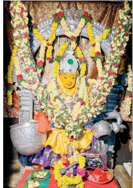
బ్రహ్మచారిణి అలంకరణలో సరస్వతి అమ్మవారు