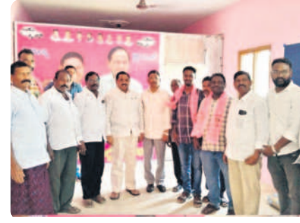
మధిర టౌన్ : పార్టీలో చేరిన వారితో కమల్ రాజు, కొండబాల, మధిర : సీడీ ఆవిష్కరిస్తున్న మంత్రి పువ్వాడ

మధిర, అక్టోబర్ 16: ఎన్నికల ప్రచారంలో భాగంగా మధిర చేరుకున్న మంత్రి పువ్వాడ మాధవమధ్యమంలో మధిర అంబేద్కర్ సెంటర్ వద్ద ఓ వ్యక్తిని గుర్తుతెలియని వాహనం డీకొని గాయాలయ్యాయి. మంత్రి వెంటనే కారు దిగి తన కాన్వాయిలో మధిర ప్రభుత్వ ఆసుపత్రికి తరలించి మానవత్వాన్ని చాటుకున్నారు. అనంతరం వైద్యులను కలిసి సదరు వ్యక్తికి మెరుగైన వైద్యం అందించాలని సూచించారు.