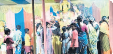
బోనకల్లు : ముష్టికుంట్లలో భక్తుల పూజలు

బోనకల్లు, అక్టోబర్ 16: మండలంలోని ముష్టికుంట్ల గ్రామంలో ముత్యాలమ్మ సెంటర్ వద్ద భక్తులు ప్రత్యేకంగా లక్ష్మి, సరస్వతి, దుర్గాదేవీ విగ్రహాల వద్ద భక్తులు సోమవారం పూజలు నిర్వహించారు. మండలంలో విగ్రహాల సమీపంలో బతుకమ్మ పండుగ సంబురాలను జరుపుకున్నారు. రకరకాల పూలను సేకరించి బతుకమ్మలను తయారు చేసి మహిళలు, పిల్లలు కోలాటాలు ఆడుతూ బతుకమ్మను సమీప చెరువుల్లో నిమజ్జనం చేశారు.