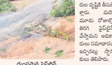
ధ్వంసమైన పైప్ లైన్