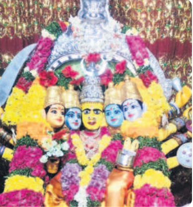
ఎర్రపాలెం : హోమంవద్ద పూజలు నిర్వహిస్తున్న అర్చకులు, మధిర టౌన్ : గాయత్రిదేవీ అలంకరణలో అమ్మవారు

మధిర టౌన్, అక్టోబర్ 16: మధిర పట్టణంలోని శ్రీవాసవి కన్యకా పరమేశ్వరి ఆలయంలో దేవీశరన్నవరాత్రి ఉత్సవల్లో భాగంగా రెండోరోజు అమ్మవారు గాయత్రి దేవీ అలంకరణలో భక్తులకు దర్శనమిచ్చారు. ప్రత్యేకంగా ఏర్పాటు చేసిన ముఖద్వారం నుంచి భక్తులు అమ్మ