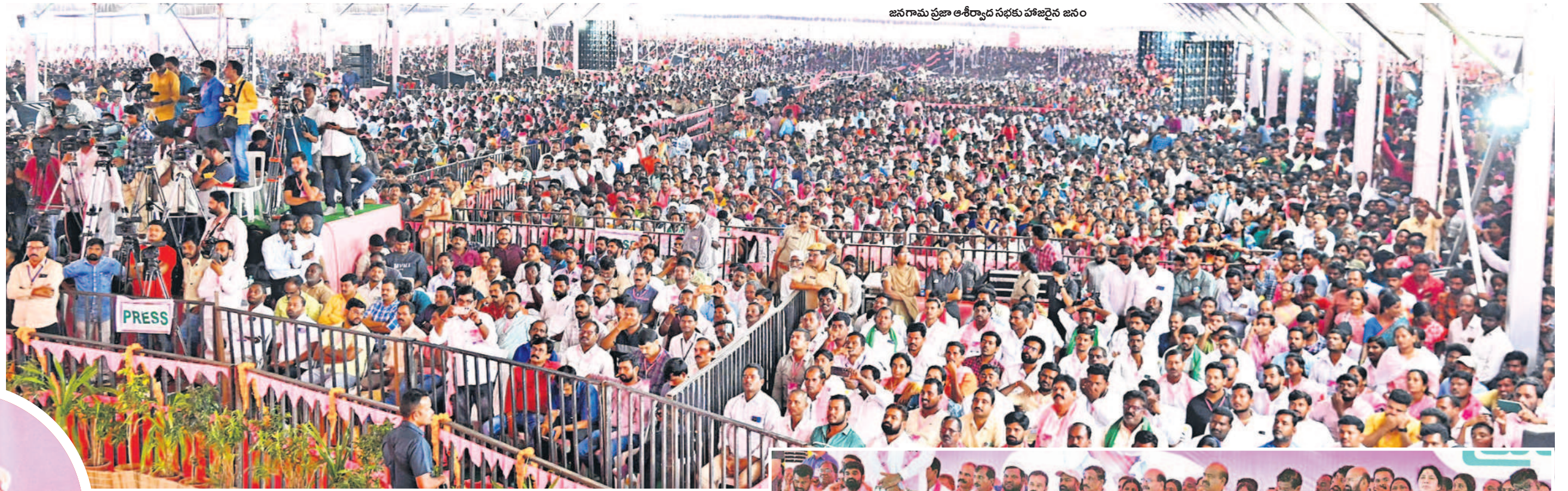
జనగామ ప్రజా ఆశీర్వాద సభకు హాజరైన జనం