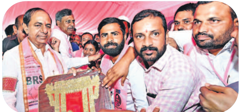
నీఎం కేసీఆర్ కు జ్ఞాపకాలను అందజేస్తున్న జిఎల్ఎస్ శ్రేణులు