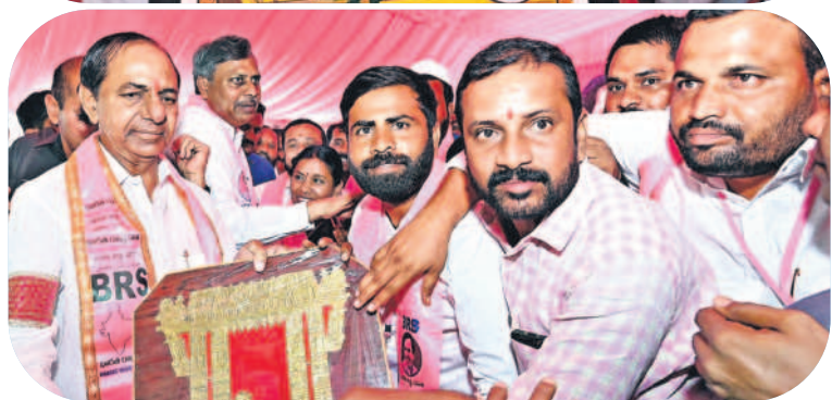
సీఎం కేసీఆర్ కు జ్ఞాపకాలను అందజేస్తున్న జిఆర్ఎస్ శ్రేణులు