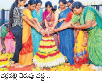
చర్లపల్లి వెరువు వద్ద ..

బతుకమ్మ ఉత్సవాలు.. బతుకమ్మ సంబురాలు భాగంగా రామంతాపూర్, చర్లపల్లి, తదితర ప్రాంతాల్లో సోమవారం బతుకమ్మ సంబురాలు ఘనంగా నిర్వహించారు. ఈ మేరకు మహిళలు, యువతులు, విద్యార్థినులు ఆటపాటలు, కోలాటాలతో సందడి చేశారు. బతుకమ్మ ఆడుతూ తెలంగాణ సంస్కృతిని, సంప్రదాయాలను తెలియజేస్తూ పాటలు పాడారు. - ఉప్పల్, అక్టోబర్ 16