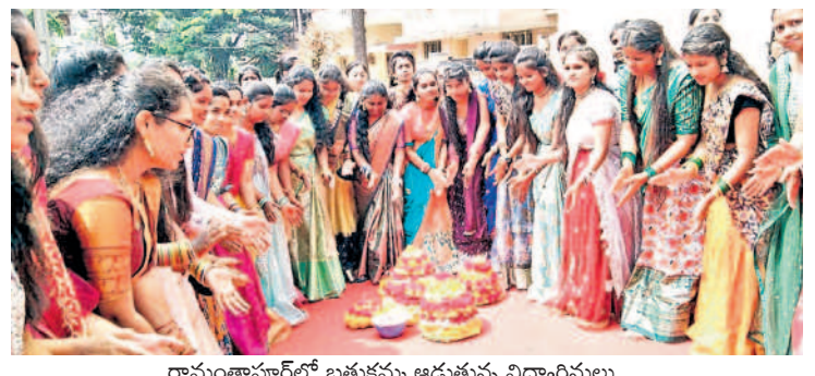
రామంతాపూర్ లో బతుకమ్మ ఆడుతున్న విద్యార్థినులు

బతుకమ్మ ఉత్సవాలు.. బతుకమ్మ సంబురాలు భాగంగా రామంతాపూర్, చర్లపల్లి, తదితర ప్రాంతాల్లో సోమవారం బతుకమ్మ సంబురాలు ఘనంగా నిర్వహించారు. ఈ మేరకు మహిళలు, యువతులు, విద్యార్థినులు ఆటపాటలు, కోలాటాలతో సందడి చేశారు. బతుకమ్మ ఆడుతూ తెలంగాణ సంస్కృతిని, సంప్రదాయాలను తెలియజేస్తూ పాటలు పాడారు. - ఉప్పల్, అక్టోబర్ 16