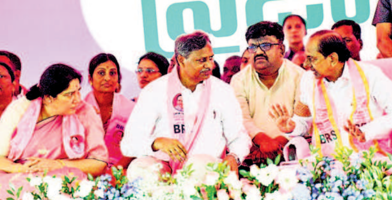
వేదికపై అభ్యర్థి పల్లాతో ముచ్చటొస్తున్న సీఎం కేసీఆర్, పక్కన మంత్రి సత్యనది రాథోడ్