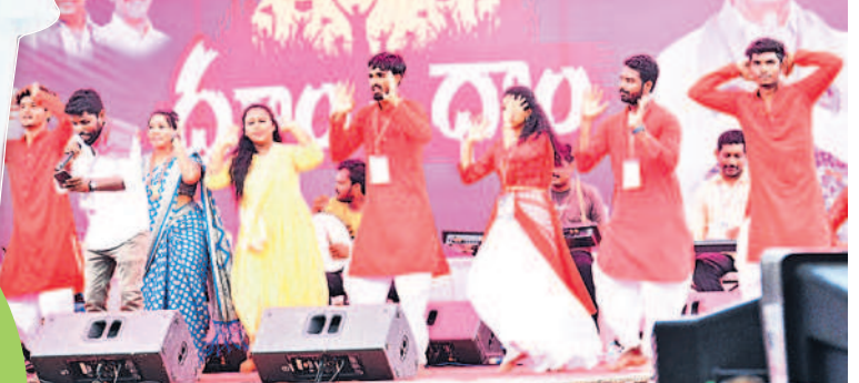
వేదికపై ఆటపాటలతో హోరెత్తిస్తున్న కళాకారులు

ఆగం కావొద్దు.. ఆలోచనతో ఓటియాలై.. 'ఓటు అనేది ప్రజల తలరాతను, తెలంగాణ భవిష్యత్తును ప్రభావితం చేస్తుంది. ఎన్నికలు రాగానే ఆగమాగం కాకుండా స్పష్టమైన అవగాహనతో ప్రజలు ఆలోచనతో ఓటియాలై' అని సీఎం కేసీఆర్ సూచించారు. జనగామ ప్రజా ఆశీర్వాద సభ వేదికగా ఎన్నికల శంఖారావాన్ని పూరించిన ఆయన, తెలంగాణలో తొమ్మిదేండ్లలో జరిగిన అభివృద్ధిని కళ్లగట్టారు.