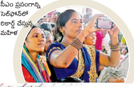
సీఎం ప్రసంగాన్ని సెల్ఫోన్లో రికార్డ్ చేస్తున్న మహిళ