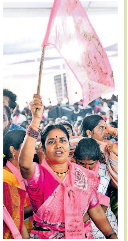
గులాబీ జెండాతో బీఆర్ఎస్ మహిళా నేత