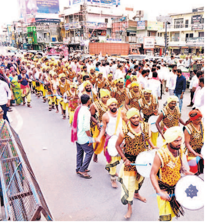
డప్పుచప్పులతో ర్యాలీగా వస్తున్న కళాకారులు

600మందితో భారీ బందోబస్తు.. వరంగల్ సీపీ అంబర్ కిశోర్ రూూ నేతృత్వంలో సభకు 600మంది పోలీసులతో భారీ బందోబస్తు కల్పించారు. వెస్ట్కోస్ డిసీపీ పీ సీతారాం, ఆరుగురు ఏసీపీలు హెలిప్యాక్, సభా ప్రాంగణం, సభా వేదిక, వీఐపీ, మీడియా గ్యాలరీ, పార్కింగ్ ప్రాంతాల్లో భద్రత కల్పించారు. 14 మంది సీబలు, 34 మంది ఎస్ఐలు, ఏఎస్సీలు, హెడ్ కాన్స్టేబుల్స్, కాన్స్టేబుల్స్, హోంగార్డులు కట్టుదిట్టంగా విధులు నిర్వహించారు.