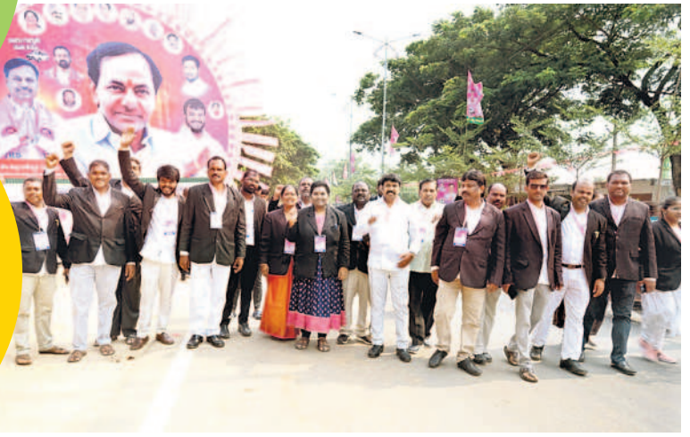
జనగామ బీఆర్ఎస్ అభ్యర్థి పల్లాకు మద్దతుగా ర్యాలీ తీస్తూ సభకు వస్తున్న న్యాయవారులు