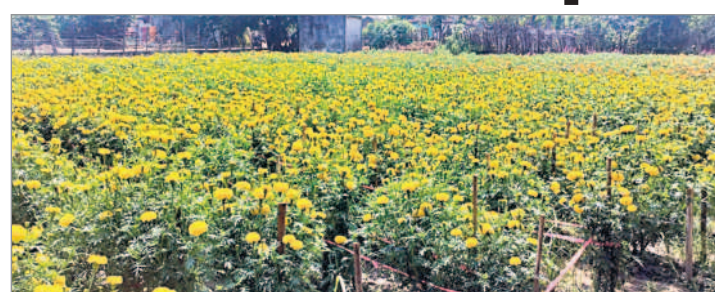
బతుకమ్మ వేడుకలకు చేతికొచ్చిన పూలు

షట్పల్లి గ్రామంలో రైతులు సాగు చేస్తున్న బంతి తోట. కోటపల్లి, అక్టోబర్ 12 : బంతిపూలకు భలే గిరాకీ ఏర్పడింది. బతుకమ్మ పండుగ సందర్భంగా ఈ పూలకు డిమాండ్ ఉండడంతో, ఈ సంవత్సరం రైతులు సాగుపై దృష్టి పెట్టారు. కోటపల్లి మండలంలోని షట్పల్లి, బావనపల్లి, కొండంపేట గ్రామాల్లో రైతులు పెద్ద ఎత్తున బంతిపూల పంటను వేశారు.