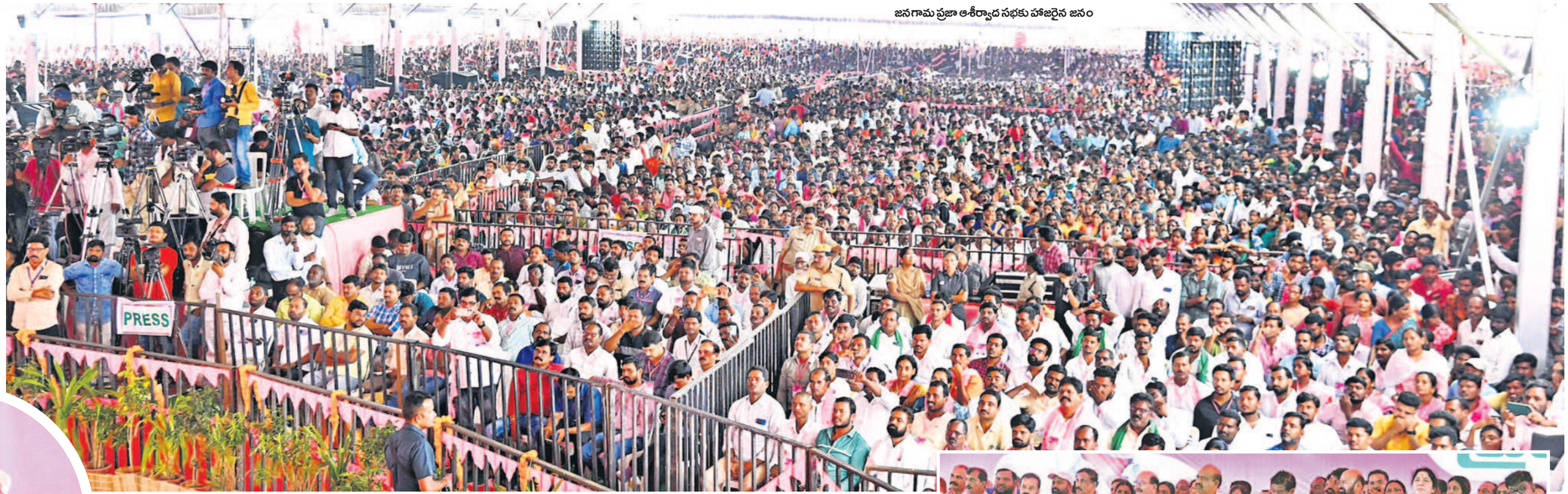
జనగామ ప్రజా ఆశీర్వాద సభకు హాజరైన జనం