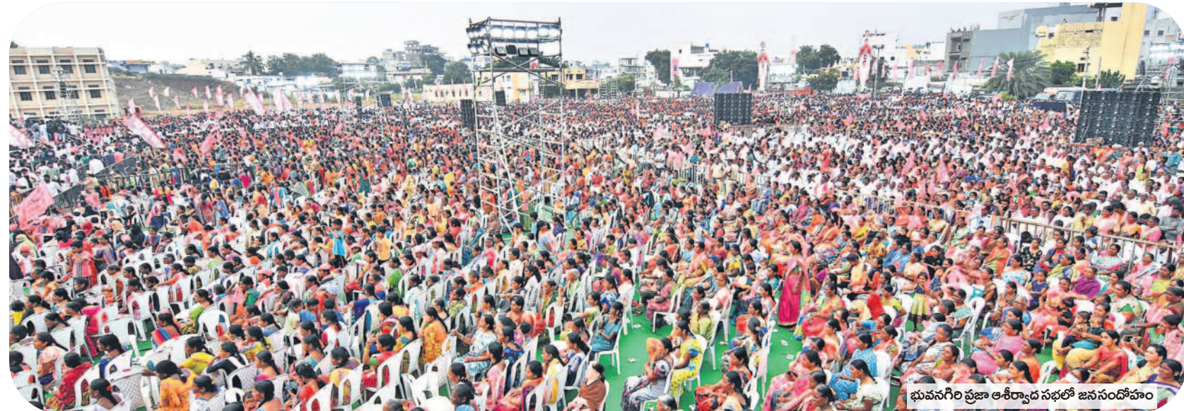
భువనగిరి ప్రజా ఆశీర్వాద సభలో జనసందోహం