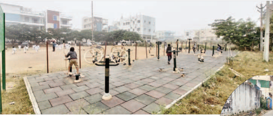
పద్మావతికాలనీ పార్కులో ఓపెన్జిమ్