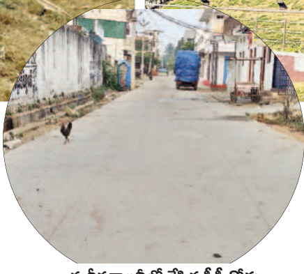
మదీనకాలనీలో వేసిన సీసీ రోడ్డు