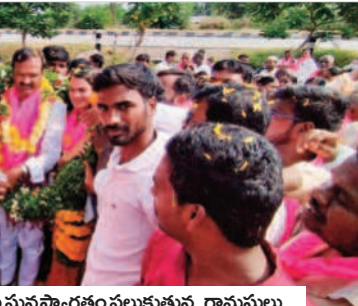
అన్నాసాగర్ లో ఎమ్మెల్యే ఆల దంపతులకు ఘనస్వాగతం పలుకుతున్న గ్రామస్థులు