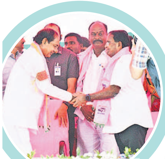
పాన్నాల లక్షయ్యను బీఆర్ఎస్ లోకి సాదరంగా ఆహ్వానిస్తున్న సీఎం కేసీఆర్

భవిష్యత్ లో ఐటీ కారిడార్.. పరిశ్రమలతో ప్రగతిబావుటా ఎగరేస్తది