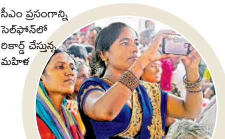
సీఎం ప్రసంగాన్ని సెల్ఫోన్లో రికార్డ్ చేస్తున్న మహిళ