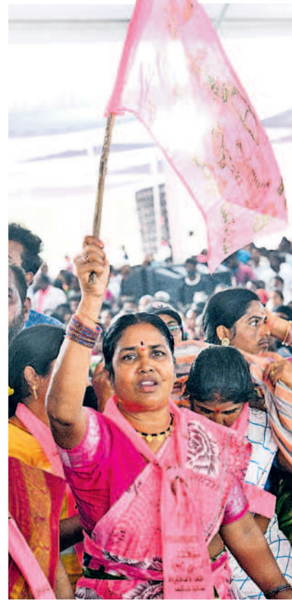
గులాబీ జెండాతో బీఆర్ఎస్ మహిళా నేత