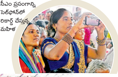
సీఎం ప్రసంగాన్ని సెల్ఫోన్లో రికార్డ్ చేస్తున్న మహిళ

గులాబీ జెండాలో రామక్క... జనగామ గడ్డ పల్లా అడ్డ.. 'గులాబీల జెండాలో రామక్క.. గుర్తుల గుర్తులమకో రామక్క' 'జనగామ గడ్డ.. పల్లా అడ్డ.. పల్లాకు అడ్డెవడు' అనే పాటలు సభలో మార్మోగాయి. కళాకారులు ఈ పాటలు పాడుతుంటే సభికుల నుంచి మంచి స్పందన వచ్చింది.