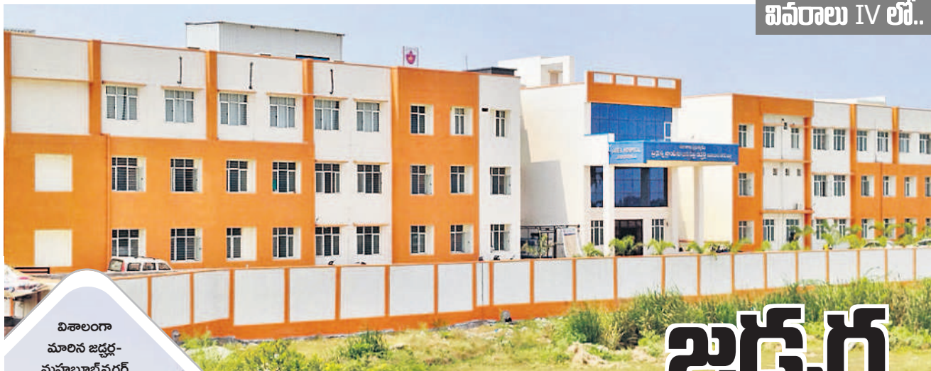
ఐవరాలు IV లో..