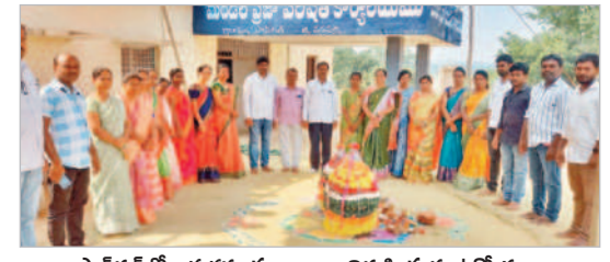
పాన్ గల్ లో బతుకమ్మ సంబురాలు నిర్వహిస్తున్న ఉద్యోగులు