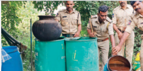
బెల్లం ఊటను సారపోస్తున్న ఎక్స్లెజ్ అధికారులు

నాగర్ కర్నూల్, అక్టోబర్ 16 : జిల్లాలో సోమవారం ఎక్స్లెజ్ అధికారులు విస్తృతంగా దాడులు నిర్వహించారు. ఈ సందర్భంగా 3 వేల కిలోల నల్ల వెల్లం, 200 కిలోల ఆలమ్, మూడుట్రైల్ ఆటోను స్వాధీనం చేసుకుని 200 లీటర్ల బెల్లం ఊటను ధ్వంసం చేశారు. ఎన్నికల కోడ్ ను ఉల్లంఘించి విక్రయాలు జరుపుతున్న వ్యక్తులపై దాడులు నిర్వహించినట్లు జిల్లా ఎక్స్లెజ్ అధికారి ఫనియోద్దీన్ తెలిపారు. తెలకపల్లి ఎక్స్లెజ్ సర్కిల్ పరిధిలో జరిగిన దాడుల్లో 3000 కేజీల బెల్లంతో పాటు, 200 కిలోల ఆలమ్, ఆటో స్వాధీనం చేసుకున్నట్లు వెల్లడించారు. అదేవిధంగా 200 లీటర్ల బెల్లం ఊట ధ్వంసం చేసి ఇద్దరిని అరెస్ట్ చేశామన్నారు. ఎలక్షన్ కోడ్ వచ్చిన నాటినుంచి అప్పంపేట, కొల్లాపూర్, తెలకపల్లి, కల్వకుర్తి, నాగర్ కర్నూల్ స్టేషన్లలో విస్తృత దాడులు చేస్తూ ఇప్పటివరకు సారాకు సంబంధించి 38 కేసులు, 293 లీటర్ల సారా, 450 కేజీల ఆలమ్, 9290 లీటర్ల బెల్లం ఊట, 3178 కేజీల నల్లబెల్లం, 5 వెహికల్స్, 20 మందిని అరెస్ట్ చేసి 52 మందిని బైండోవర్ చేయడం జరిగిందని తెలిపారు. బెల్లం షాపిలకు సంబంధించి 15 కేసులు, 56 లీటర్ల మద్యం 45 లీటర్ల బీర్ స్వాధీనం చేసుకుని 13 మందిని అరెస్ట్ చేసినట్లు వెల్లడించారు. ఇప్పటివరకు స్వాధీనం చేసుకున్న వాటి విలువ రూ.14 లక్షల 50 వేల విలువ ఉంటుందని ఆయన తెలిపారు. జిల్లా పరిధిలోని 67 వైస్ షాపిలను నేడు తనిఖీ చేసి లైసెన్స్ దారులందరికీ ఎన్నికల నియమాళి వీవరించి అన్ని రికార్డులను ఆడిట్ చేయడం జరిగిందని జిల్లా ఎక్స్లెజ్ అధికారి ఫయాజుద్దీన్ తెలిపారు.