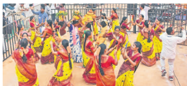
సభా వేదిక వద్ద మహిళల కొలాటం