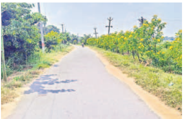
కేసీఆర్ దత్తత గ్రామం దేశాయిపల్లెలో వేసిన బీటీ రోడ్డు