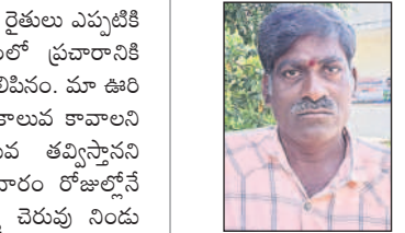
ఉద్యమంలో కేసీఆర్ కు మా దేశాయిపల్లె మద్దతు ఇచ్చింది. కేసీఆర్ కు జై కొట్టినం. ఏకగ్రీవంగా ఓటిస్తూమని చెప్పినం. కేసీఆర్ సారిన దత్తత తీసుకున్నడు. సారంపల్లి నుంచి దేశాయిపల్లె, మల్కాపూర్ నుంచి మున్సిపాలిటీ రోడ్డు వరకు బీటీ రోడ్డు వేసిండు. నీళ్ల ట్యాంకు కట్టించిండు. యాదవ కమ్మూనిటీకి పైసలు ఇచ్చిండు. అడిగినవన్నీ చేసిండు. గెలిచినా వచ్చి విందు ఇచ్చిండు. మల్కాపూర్ ఆలయంలో తీగల ఏల్లమ్మ ఆలయంను దర్శించుకున్నాం. ఇప్పటికీ కేసీఆర్ ను యాదా చేసుకుంటం. ప్రజా ఆశీర్వాద సభ కోసం ఎదురు చూస్తున్నం.