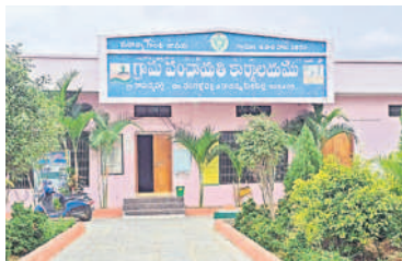
కేసీఆర్ దత్తత గ్రామం రామన్నపల్లె

● నాడు ఉద్యమ సారథి కేసీఆర్ కు అండగా నిలిచిన రామన్నపల్లె, దేశాయిపల్లె ● కరింనగర్ ఎంపీగా గెలిచిన తర్వాత గ్రామాల దత్తత ● అధికారం చేపట్టిన తర్వాత అభివృద్ధి ● సీఎం కేసీఆర్ సిరిసిల్ల పర్యటన నేపథ్యంలో మునిసిపాలిటీ గ్రామస్తులు