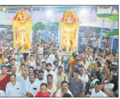
వాహనంపై ఊరేగింపును అమ్మవారు