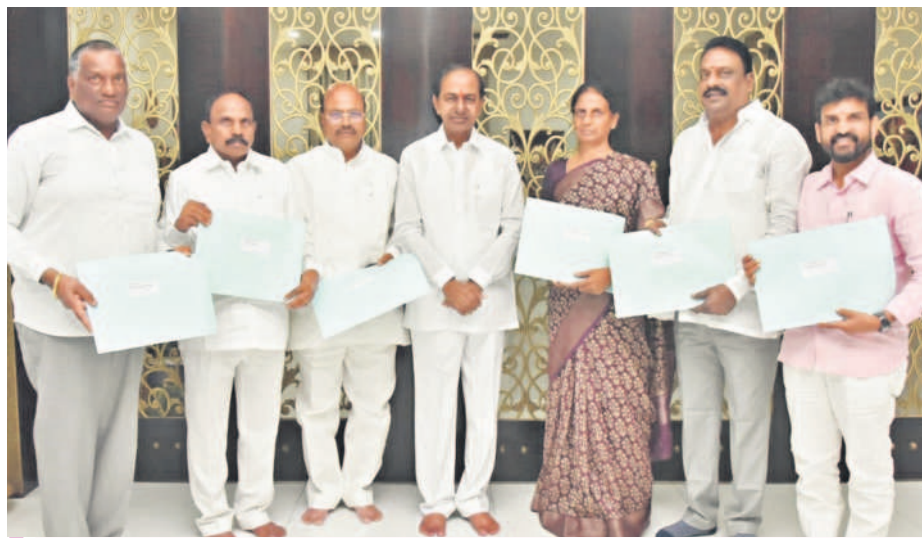
ఉమ్మడి రంగారెడ్డి జిల్లా అభ్యర్థులకు ప్రగతి భవన్ లో బీఫామ్ లను అందజేసిన సీఎం కేసీఆర్