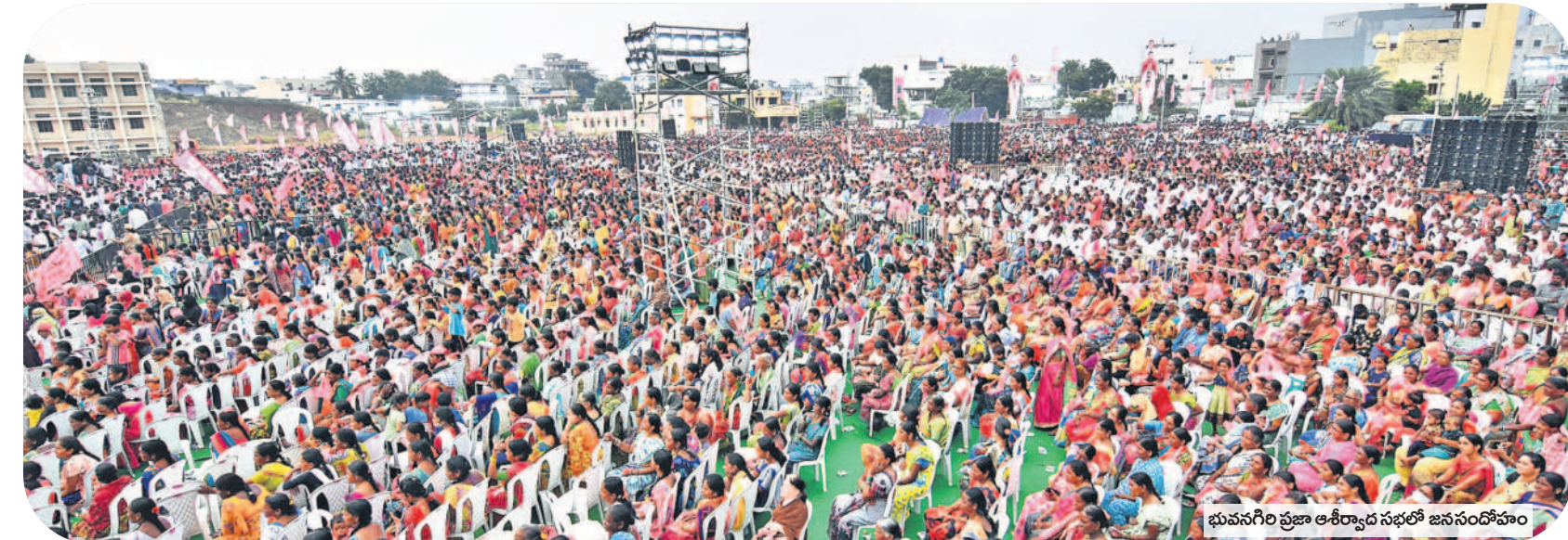
భువనగిరి ప్రజా ఆశీర్వాద సభలో జనసందోహం