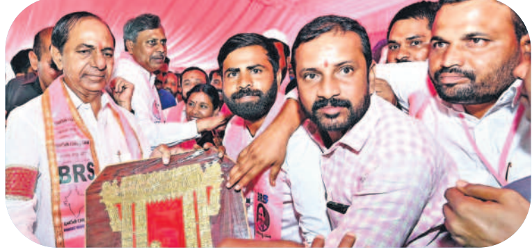
సీఎం కేసీఆర్ కు జ్ఞాపకలను అందజేస్తున్న జి.ఆర్.ఎస్ శ్రేణులు