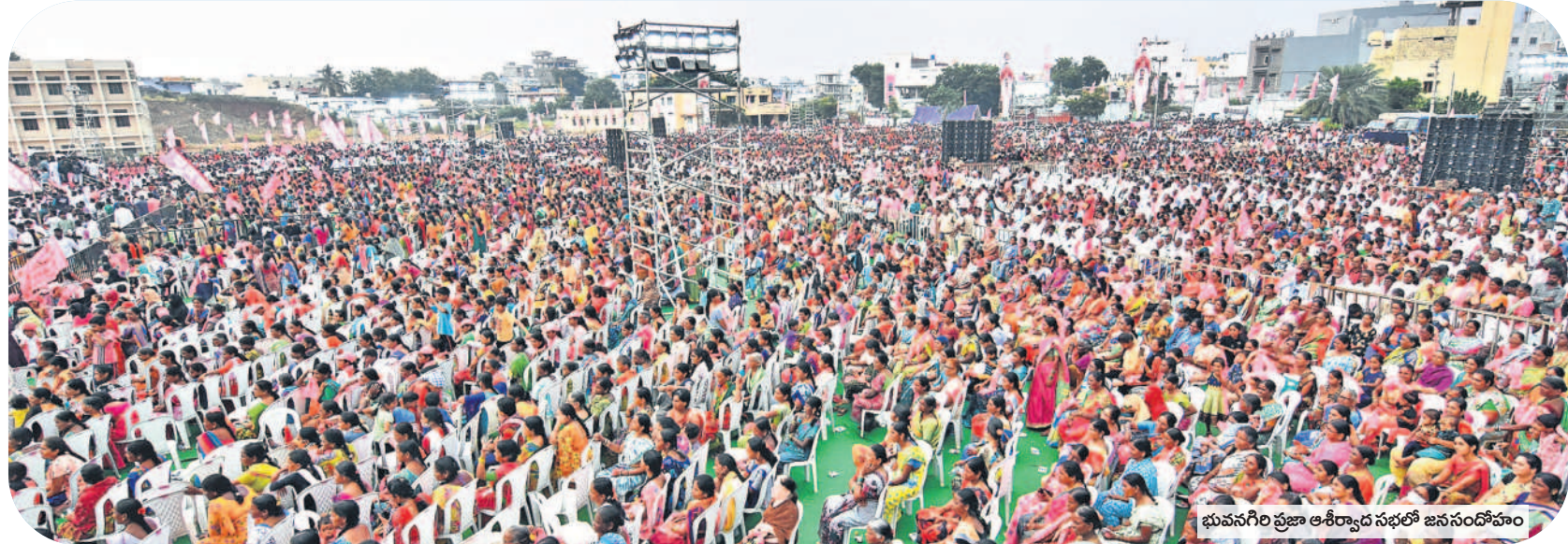
భువనగిరి ప్రజా ఆశీర్వాద సభలో జనసందోహం