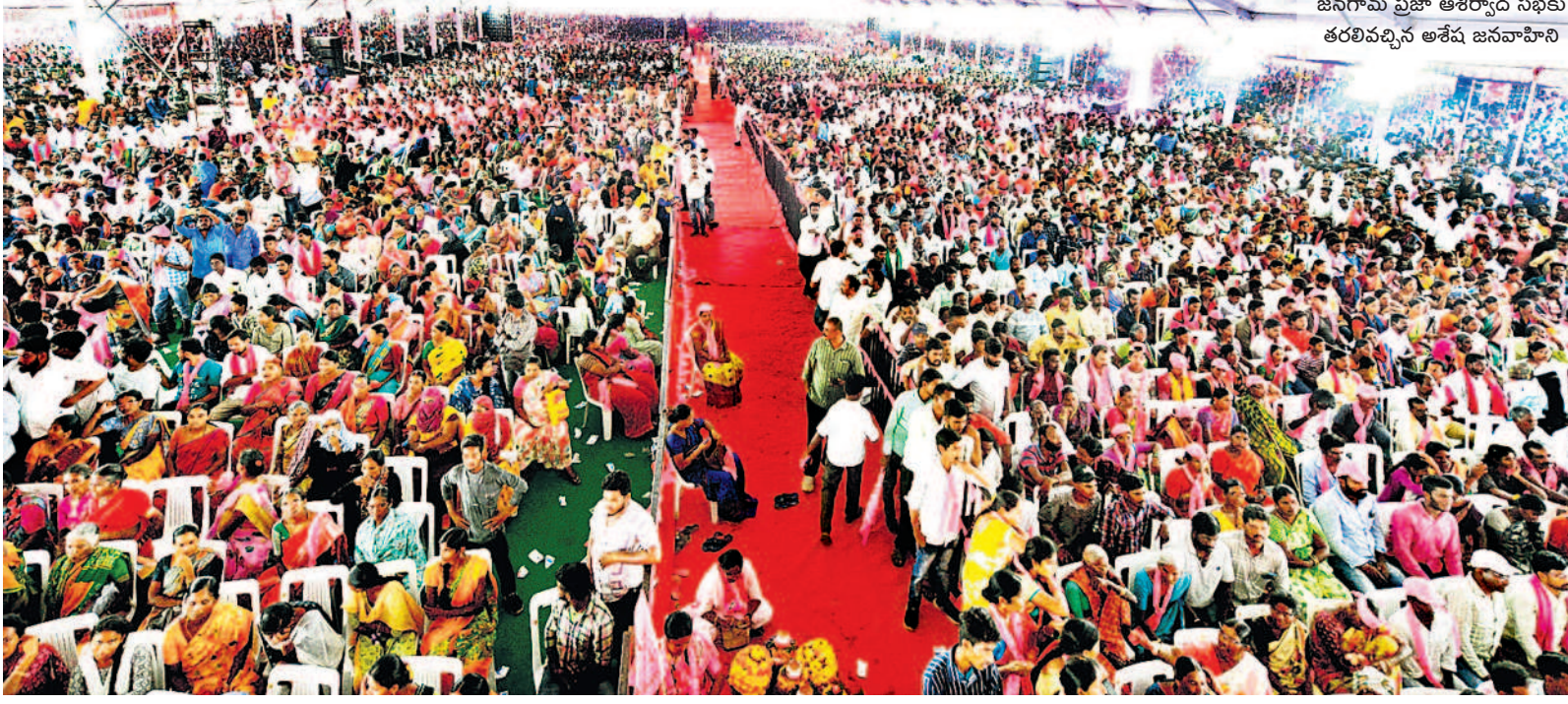
జనగామ ప్రజా ఆశీర్వాద సభకు తరలివచ్చిన అనేక జనవాసిని