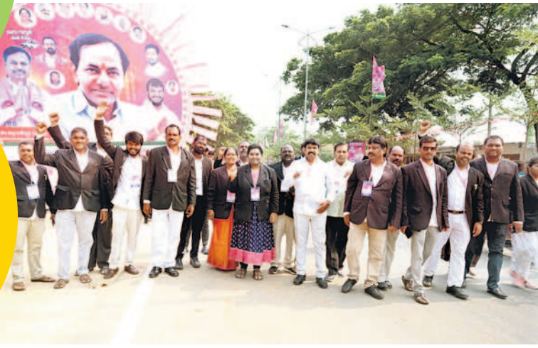
జనగామ బీఆర్ఎస్ అభ్యర్థి పల్లాకు మద్దతుగా ర్యాలీ తీస్తూ సభకు వస్తున్న న్యాయవారులు