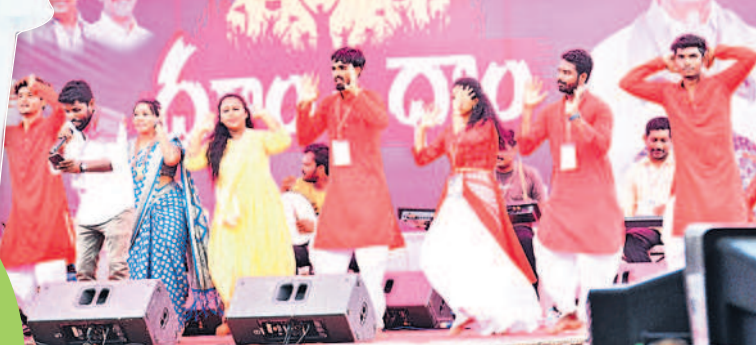
వేదికపై ఆటపాటలతో హోరెత్తిస్తున్న కళాకారులు

'ఓటు అనేది ప్రజల తలరాతను, తెలంగాణ భవిష్యత్తును ప్రభావితం చేస్తుంది. ఎన్నికలు రాగానే ఆగమాగం కాకుండా స్పష్టమైన అవగాహనతో ప్రజలు ఆలోచనతో ఓటియాలై' అని సీఎం కేసీఆర్ సూచించారు. జనగామ ప్రజా ఆశీర్వాద సభ వేదికగా ఎన్నికల శంఖారావాన్ని పూరించిన ఆయన, తెలంగాణలో తొమ్మిదేండ్లలో జరిగిన అభివృద్ధిని కళ్లగట్టారు.