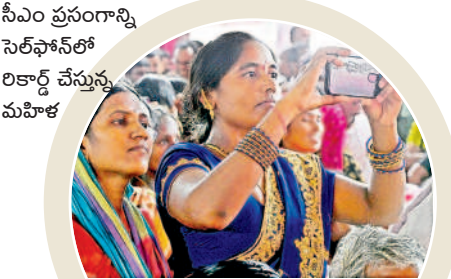
సీఎం ప్రసంగాన్ని సెల్ఫోన్లో రికార్డ్ చేస్తున్న మహిళ