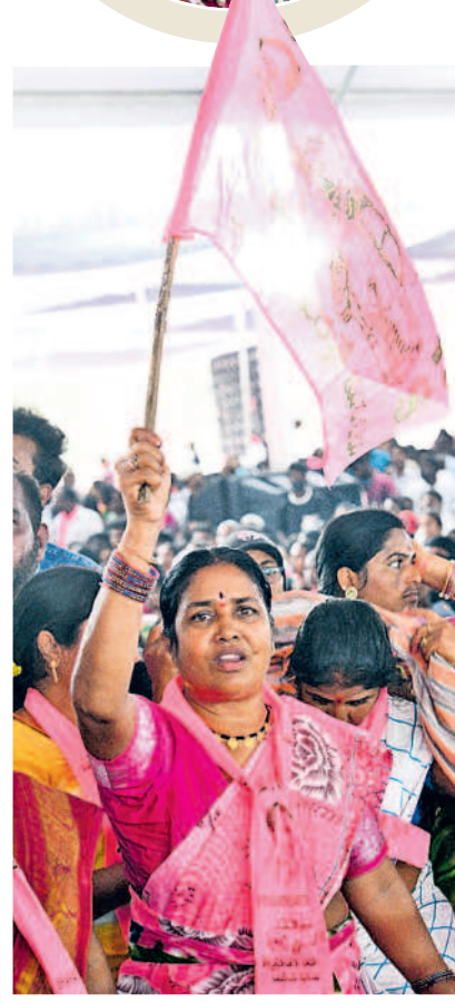
గులాబీ జెండాతో బీఆర్ఎస్ మహిళా నేత