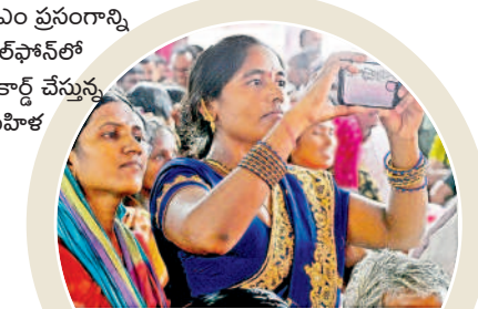
సీఎం ప్రసంగాన్ని సెల్ ఫోన్ లో రికార్డ్ చేస్తున్న మహిళ