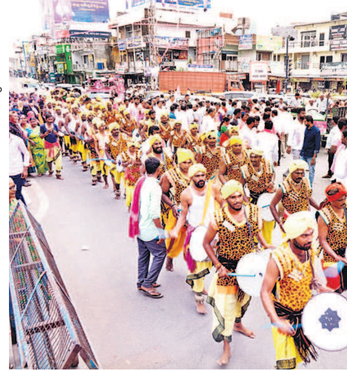
డప్పుచప్పులతో ర్యాలీగా వస్తున్న కళాకారులు

600మందితో భారీ బందోబస్తు.. వరంగల్ సీపీ అంబర్ కిశోర్ రూూ నేతృత్వంలో సభకు 600మంది పోలీసులతో భారీ బందోబస్తు కల్పించారు. వెస్ట్కోస్ డిసీపీ పీ సీతారాం, ఆరుగురు ఏసీపీలు హెలిప్యాక్, సభా ప్రాంగణం, సభా వేదిక, వీఐపీ, మీడియా గ్యాలరీ, పార్కింగ్ ప్రాంతాల్లో భద్రత కల్పించారు. 14 మంది సీబలు, 34 మంది ఎస్ఐలు, ఏఎస్సీలు, హెడ్ కానిస్టేబుళ్లు, కానిస్టేబుల్స్, హోంగార్డులు కట్టుదిట్టంగా విధులు నిర్వహించారు.