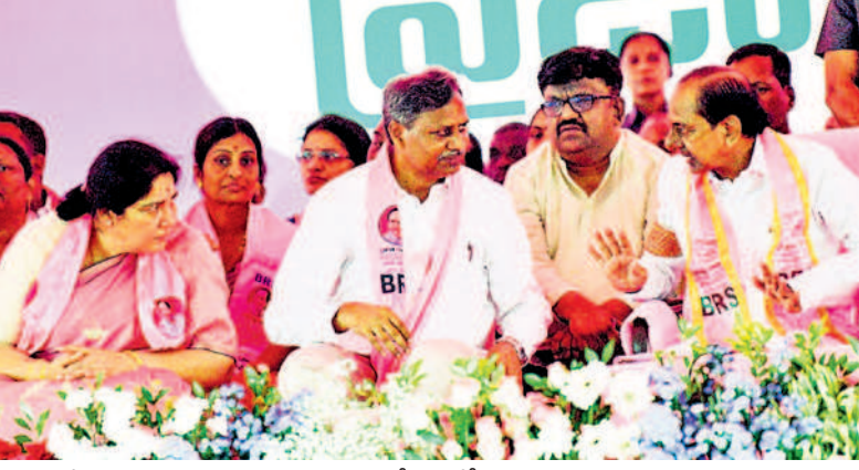
వేదికపై అభ్యర్థి పల్లాతో ముచ్చటొస్తున్న సీఎం కేసీఆర్, పక్కన మంత్రి సత్యనది రాథోడ్