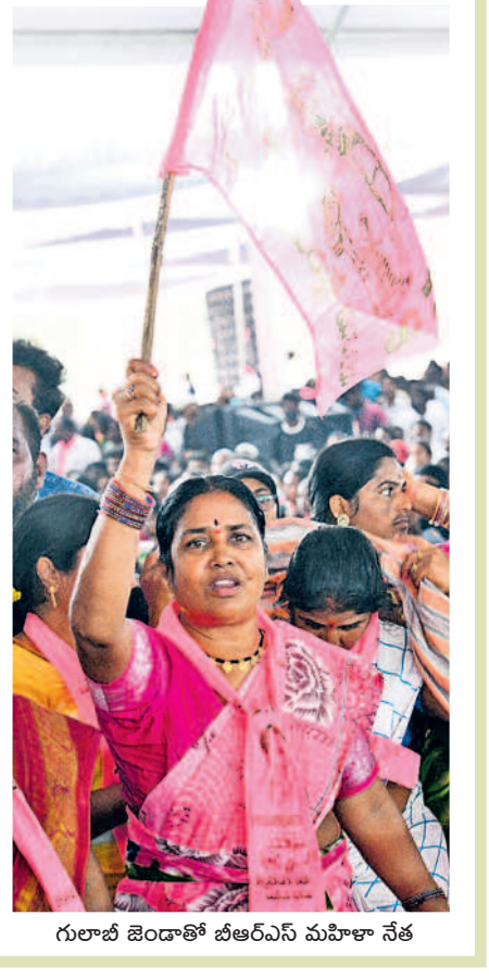
గులాబీ జెండాతో బీఆర్ఎస్ మహిళా నేత