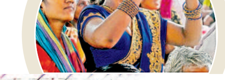
సీఎం ప్రసంగాన్ని సెల్ఫోన్లో రికార్డ్ చేస్తున్న మహిళ

గులాబీల జెండాలో రామక్క... జనగామ గడ్డ పల్లా అడ్డ.. 'గులాబీల జెండాలో రామక్క.. గుర్తుల గుర్తులతో రామక్క', 'జనగామ గడ్డ.. పల్లా అడ్డ.. పల్లాకు అడ్డెవడు' అనే పాటలు సభలో మార్చోగాయి. కళాకారులు ఈ పాటలు పాడుతుంటే సభికుల నుంచి మంచి స్పందన వచ్చింది.