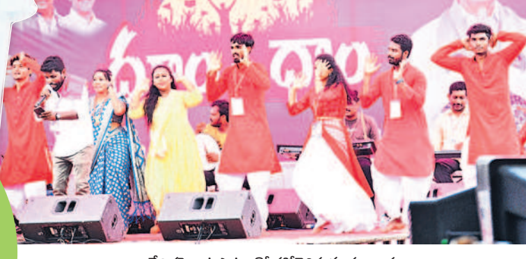
వేదికపై ఆటపాటలతో హోరెత్తిస్తున్న కళాకారులు