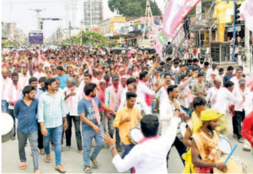
సీఎం సభకు డప్పుచప్పుళ్లతో రాల్చిగా వస్తున్న బీఆర్ఎస్ శ్రేణులు, ప్రజలు