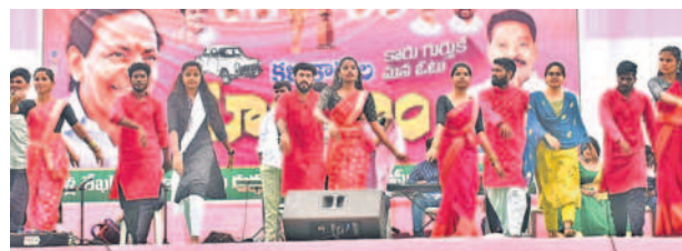
సభా వేదికపై కళాకారుల ఆటాపాట