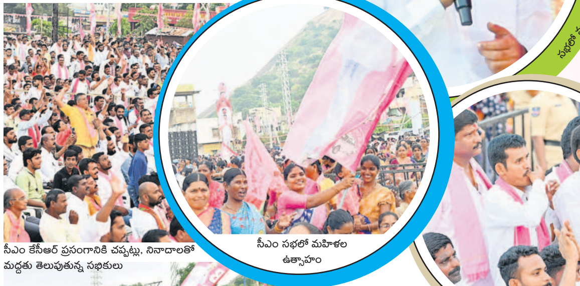
సీఎం కేసీఆర్ ప్రసంగానికి వచ్చి ఉన్న నినాదాలతో మద్దతు తెలుపుతున్న సభికులు