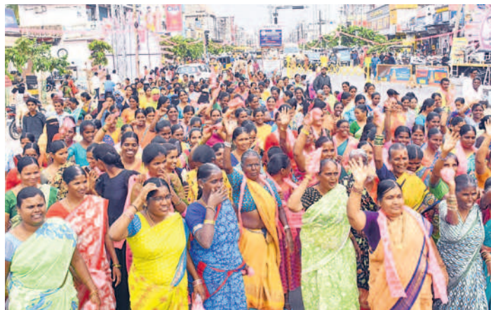
సీఎం సభకు తరలి వస్తున్న మహిళలు