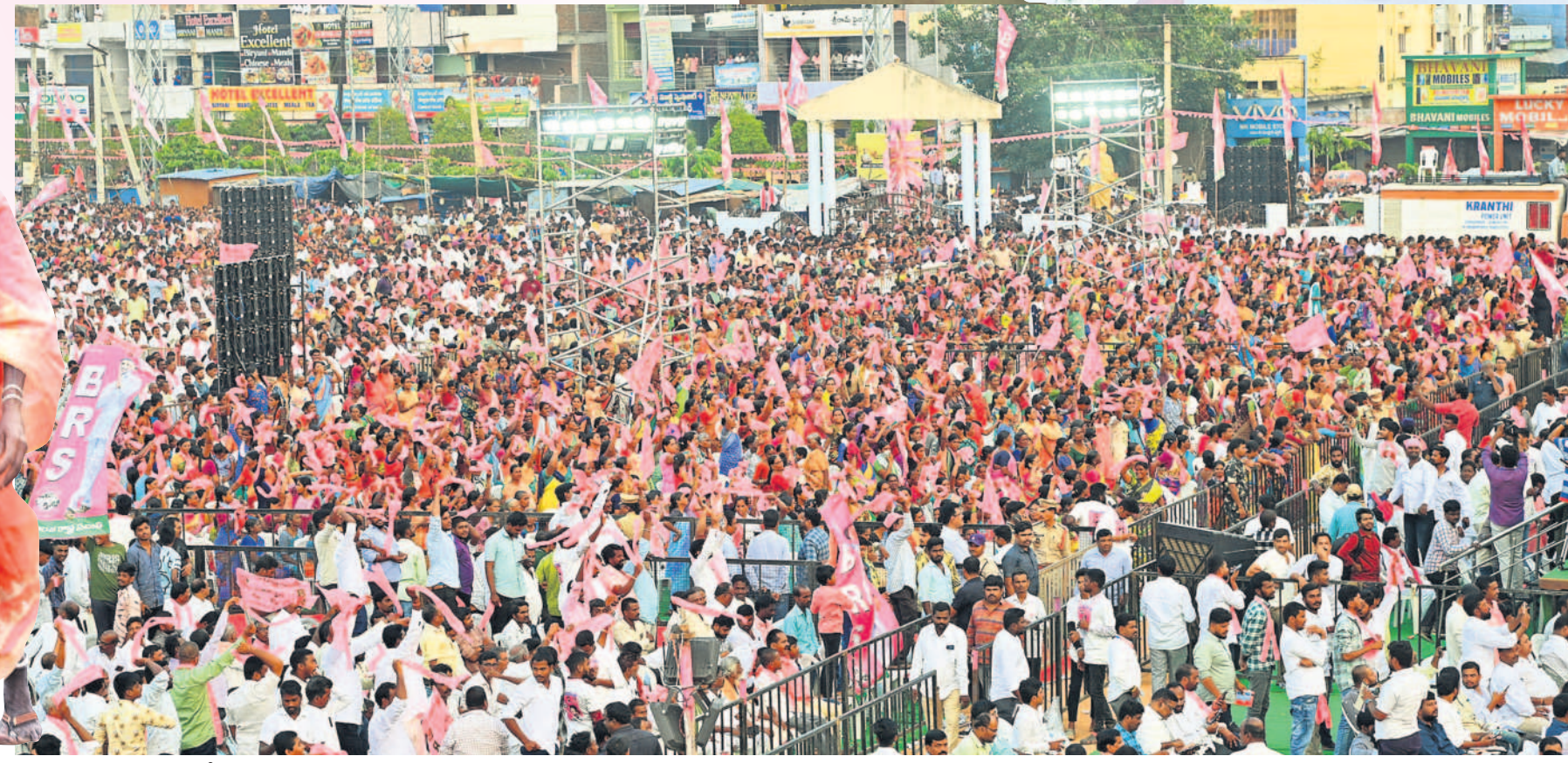
ప్రజా ఆశీర్వాద సభలో జై కేసీఆర్ నినాదాలు చేస్తున్న బీఆర్ఎస్ శ్రేణులు, ప్రజలు

సభకు వచ్చిన ప్రజలకు ఇబ్బందులు కలుగకుండా బీఆర్ఎస్ పార్టీ అన్ని ఏర్పాట్లు చేసింది. మంచినీళ్ల, మజ్జిగ ప్యాకెట్లు అందుబాటులో ఉంది. వేల సంఖ్యలో వాహనాలు రావడంతో ట్రాఫిక్ ఇబ్బందులు కలుగకుండా ఎక్కడిక్కడ పార్కింగ్ పాయింట్లను ఏర్పాటు చేసింది. దూరంగా ఉన్న సభికులకు వేదిక కనిపించేలా ఎరకాడీ స్ట్రీట్ ను ఏర్పాటు చేశారు. వేదికపై నియోజకవర్గ ముఖ్య నేతలు ఆసీనులయ్యే అవకాశం కల్పించారు. మహిళలు, వీఐపీలు, మీడియా, వృద్ధుల కోసం ప్రత్యేకంగా గ్యాలరీలు ఏర్పాటు చేశారు. సీఎం కేసీఆర్ సభకు 200 మంది పోలీసులతో భారీ బందోబస్తు నిర్వహించారు. బహిరంగ సభకు తరలివచ్చిన భిన్న జనాలను పోలీసులు ప్రత్యేకంగా ఏర్పాటు చేసిన మెటల్ డివిజ్జన్ తో తనిఖీలు చేసి లోపలికి ఆనుమతించారు. సీపీ డీఎస్ ఛాంస్, డీసీపీ రాజ్ కేంద్రం ప్రభుత్వ కమాండ్ పరిధిలో పర్యవేక్షించారు. పట్టణంలో ట్రాఫిక్ జామ్ కాకుండా చర్యలు చేపట్టారు.