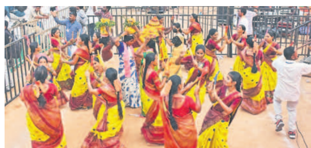
సభా వేదిక వద్ద మహిళల కొలాటం