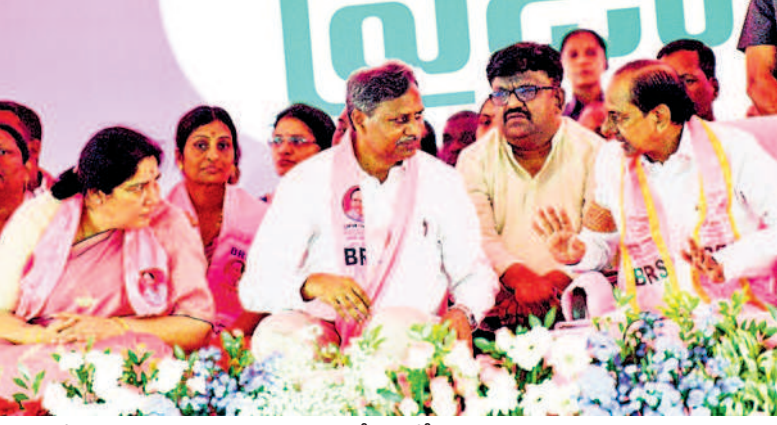
వేదికపై అభ్యర్థి పల్లాతో ముచ్చటొస్తున్న సీఎం కేసీఆర్, పక్కన మంత్రి సత్యనతి రాథోడ్