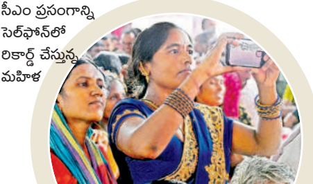
సీఎం ప్రసంగాన్ని సెల్ఫోన్లో రికార్డ్ చేస్తున్న మహిళ