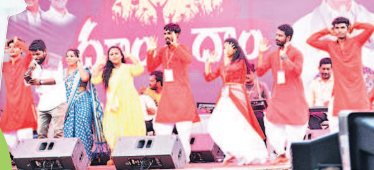
వేదికపై ఆటపాటలతో హోరెత్తిస్తున్న కళాకారులు

ఆగం కావొద్దు.. ఆలోచనతో ఓటియాలై.. 'ఓటు అనేది ప్రజల తలకాతనం, తెలంగాణ భవిష్యత్తును ప్రభావితం చేస్తుంది. ఎన్నికలు రాగానే ఆగమాగం కాకుండా స్పష్టమైన అవగాహనతో ప్రజలు ఆలోచనతో ఓటియాలై' అని సీఎం కేసీఆర్ సూచించారు. జనగామ ప్రజా ఆశీర్వాద సభ వేదికగా ఎన్నికల శంఖారావాన్ని పూరించిన ఆయన, తెలంగాణలో తొమ్మిదేండ్లలో జరిగిన అభివృద్ధిని కళ్లగట్టారు.