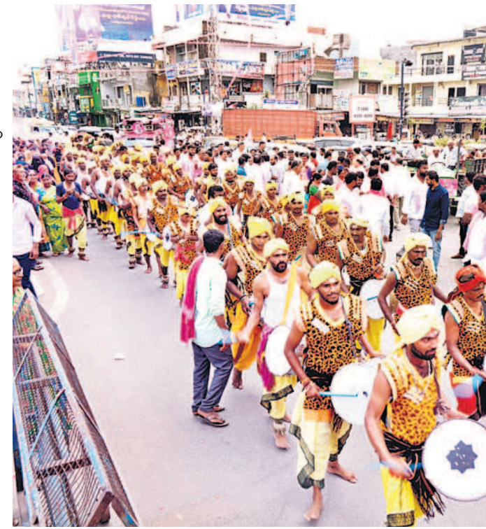
డప్పుచప్పులతో ర్యాలీగా వస్తున్న కళాకారులు

600మందితో భారీ బందోబస్తు.. వరంగల్ సీపీ అంబర్ కిలోర్ రూూ నేతృత్వంలో సభకు 600మంది పోలీసులతో భారీ బందోబస్తు కల్పించారు. వెస్ట్కోస్ డిసీపీ పీ సీతారాం, ఆరుగురు ఏసీపీలు హెలిప్యాక్, సభా ప్రాంగణం, సభా వేదిక, వీఐపీ, మీడియా గ్యాలరీ, పార్కింగ్ ప్రాంతాల్లో భద్రత కల్పించారు. 14 మంది సీబలు, 34 మంది ఎస్ఐలు, ఏఎస్సీలు, హెడ్ కానిస్టేబుళ్లు, కానిస్టేబుళ్లు, హోంగార్లు కట్టుదిట్టంగా విధులు నిర్వహించారు.