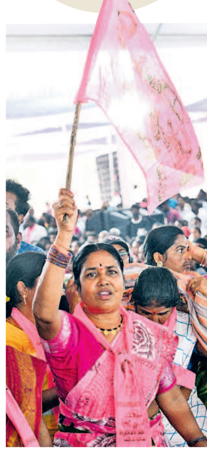
గులాబీ జెండాతో బీఆర్ఎస్ మహిళా నేత