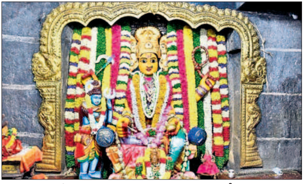
అన్నపూర్ణేశ్వరి అలంకరణలో దర్శనమిస్తున్న భద్రకాళీ అమ్మవారు