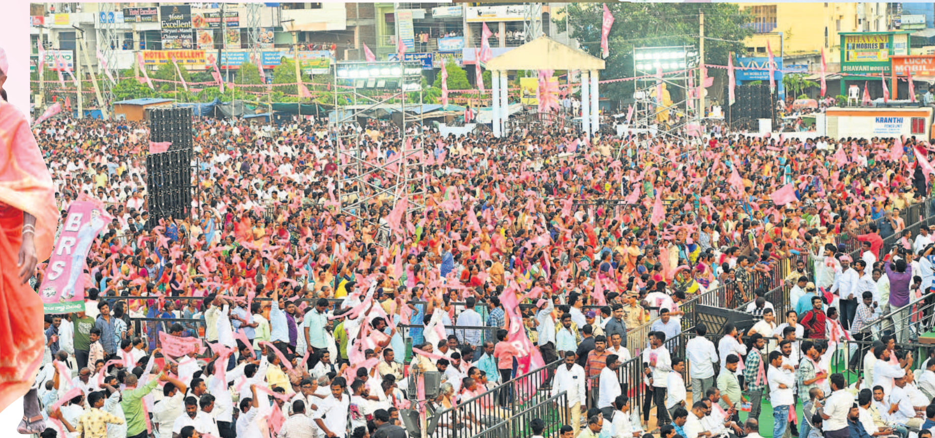
ప్రజా ఆశీర్వాద సభలో జై కేసీఆర్ నినాదాలు చేస్తున్న బీఆర్ఎస్ శ్రేణులు, ప్రజలు

సభకు వచ్చిన ప్రజలకు ఇబ్బందులు కలుగకుండా బీఆర్ఎస్ పార్టీ అన్ని ఏర్పాట్లు చేసింది. మంచినీళ్ల, మజ్జిగ ప్యాకెట్లు అందుబాటులో ఉంది. వేల సంఖ్యలో వాహనాలు రావడంతో ట్రాఫిక్ ఇబ్బందులు కలుగకుండా ఎక్కడిక్కడ పార్కింగ్ పాయింట్లను ఏర్పాటు చేసింది. దూరంగా ఉన్న సభికులకు వేదిక కనిపించేలా ఎరకాడీ స్ట్రీట్లను ఏర్పాటు చేశారు. వేదికపై నియోజకవర్గ ముఖ్య నేతలు ఆసీనులయ్యే అవకాశం కల్పించారు. మహిళలు, వీఐపీలు, మీడియా, వృద్ధుల కోసం ప్రత్యేకంగా గ్యాలరీలు ఏర్పాటు చేశారు. సీఎం కేసీఆర్ సభకు 200 మంది పోలీసులతో భారీ బందోబస్తు నిర్వహించారు. బహిరంగ సభకు తరలివచ్చిన భిన్న జనాలను పోలీసులు ప్రత్యేకంగా ఏర్పాటు చేసిన మెటల్ డివిజ్జన్లతో తనిఖీలు చేసి లోపలికి ఆనుమతించారు. సీపీ డీఎస్ ఛాంస్, డీసీపీ రాజేశ్వరం ప్ర ఎమ్మెల్యేకుమార్ల పర్యవేక్షించి పర్యవేక్షించారు. పట్టణంలో ట్రాఫిక్ జామ్ కాకుండా చర్యలు చేపట్టారు.