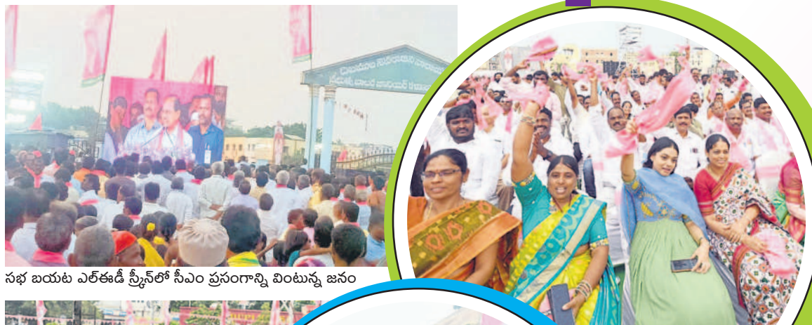
సభ బయట ఎరకాడీ స్ట్రీట్లో సీఎం ప్రసంగాన్ని వింటున్న జనం

- యాదాద్రి భువనగిరి, అక్టోబర్ 16 (నమస్తే తెలంగాణ)