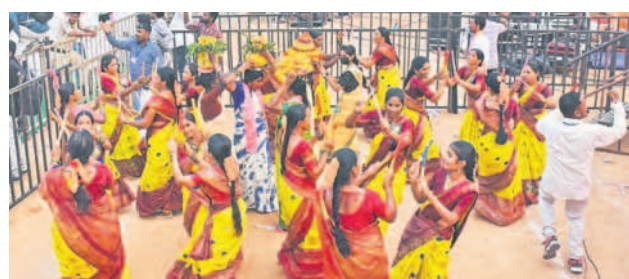
సభా వేదిక వద్ద మహిళల కొలాటం