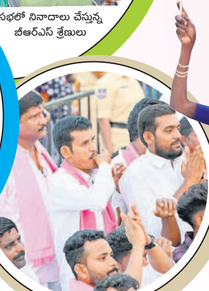
సభలో నినాదాలు చేస్తున్న బీఆర్ఎస్ శ్రేణులు