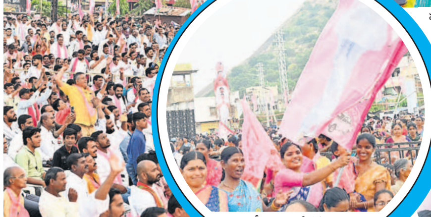
సీఎం కేసీఆర్ ప్రసంగానికి వచ్చేట్లు, నినాదాలతో మద్దతు తెలుపుతున్న సభికులు