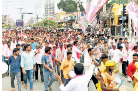
సీఎం సభకు డప్పుచప్పుళ్లతో రాల్చిగా వస్తున్న బీఆర్ఎస్ శ్రేణులు, ప్రజలు