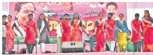
సభా వేదికపై కళాకారుల ఆటాపాట