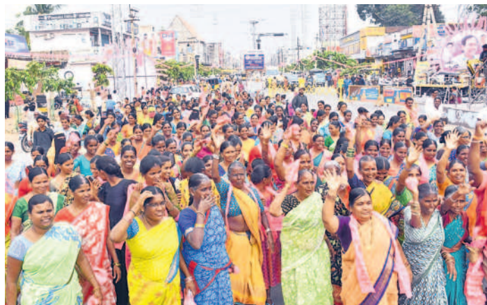
సీఎం సభకు తరలి వస్తున్న బీఆర్ఎస్ శ్రేణులు, మహిళలు