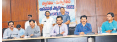
సమావేశంలో మాట్లాడుతున్న మేడ్చల్-మల్కాజిగిరి జిల్లా ఎన్నికల అధికారి, కలెక్టర్ గౌతమ్

మేడ్చల్ కలెక్టరేట్, అక్టోబర్ 17 : శాసనసభ ఎన్నికల్లో సెక్టోరియల్ అధికారులు ప్రముఖపాత్ర పోషించాలని మేడ్చల్-మల్కాజిగిరి జిల్లా ఎన్నికల అధికారి, కలెక్టర్ గౌతమ్ అన్నారు. మంగళవారం కలెక్టరేట్ సమావేశ మందిరంలో సెక్టోరియల్ అధికారులతో ప్రత్యేక సమావేశం నిర్వహించారు. ఈ సందర్భంగా ఆయన మాట్లాడుతూ.. జిల్లాలోని ఐదు నియోజకవర్గాలకు చెందిన సెక్టోరియల్ అధికారులతోపాటు ప్రతి నియోజకవర్గానికి చెందిన పది మంది చొప్పున మార్కెట్ ట్రేసర్లను ఎంపిక చేసి ప్రిసైడింగ్ అధికారులు, అసిస్టెంట్ ప్రిసైడింగ్ అధికారులకు ఎన్నికల విధులపై శిక్షణ ఇచ్చామన్నారు. అనంతరం ఈ విషయంపై అధికారులకు అవగాహన కల్పించారు. ఈ సమావేశంలో అదనపు కలెక్టర్ విజయేందర్ రెడ్డి, జిల్లా