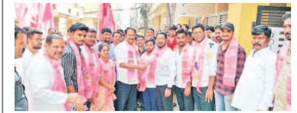
బీఆర్ఎస్ లో సాఫ్ట్ వేర్ ఇంజనీర్ల చేరిక