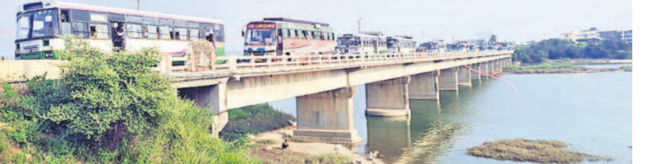
ప్రజాఅశీర్వాద సభకు బస్సుల్లో వస్తున్న మహిళలు | ప్రజాఅశీర్వాద సభకు వస్తున్న బస్సులు