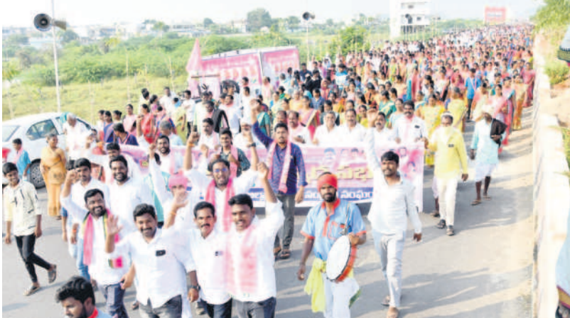
ప్రజాఅశీర్వాద సభకు ఉత్సాహంగా వస్తున్న జనం