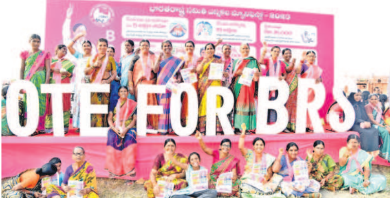
సభలో కేటీఆర్ ని మూసిఫినో స్టేజీ వద్ద నినాదాలు చేస్తున్న మహిళలు