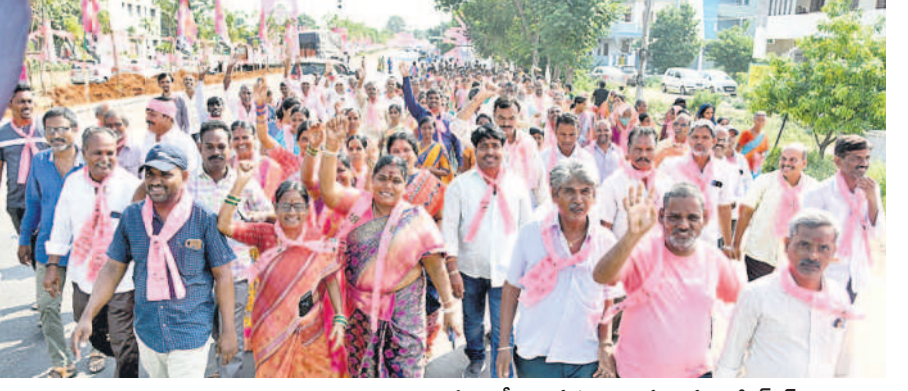
ప్రజాఅశీర్వాద సభకు నినదనూ వస్తున్న జీఆర్ఎస్ నాయకులు