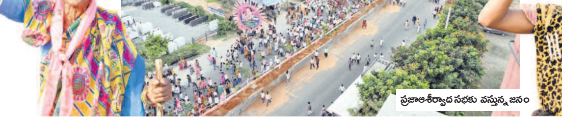
ప్రజాఅశీర్వాద సభకు వస్తున్న జనం