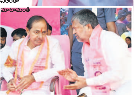
ముఖ్యమంత్రి కేసీఆర్ తో ఎమ్మెల్యే రమణ మాటామంతి