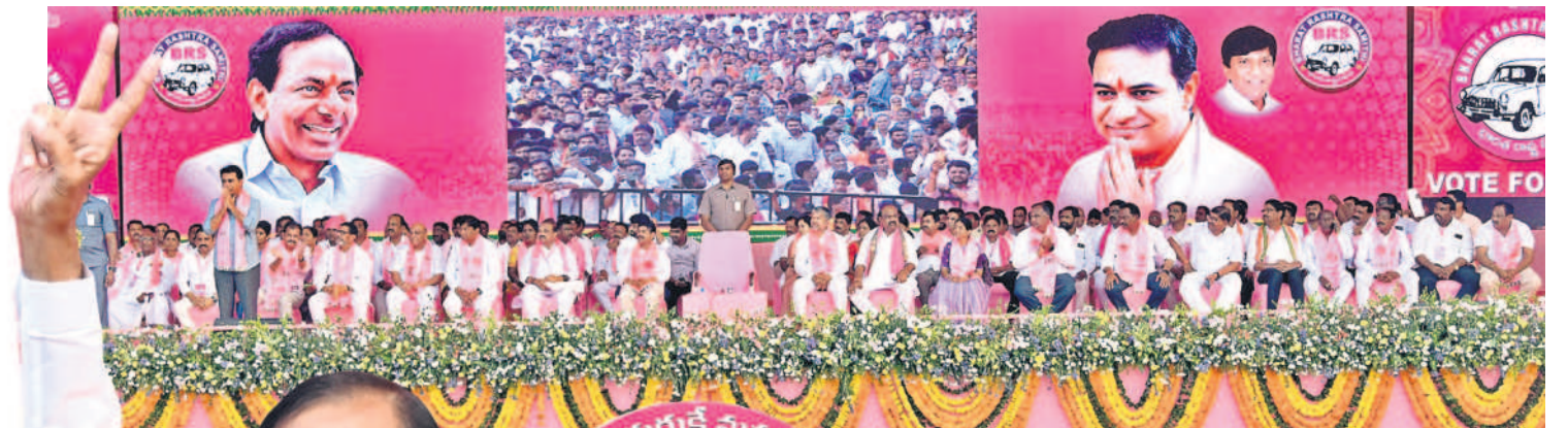
సిరిసిల్ల ప్రజా అశీర్వాద సభకు హాజరైన ప్రజలకు నమస్సునిస్తున్న మంత్రి కేటీఆర్, పక్కన జీఆర్ఎస్ నాయకులు