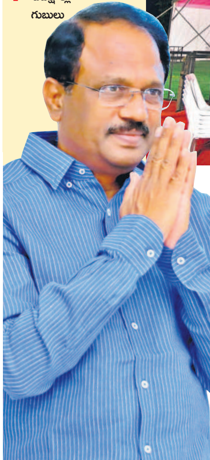
జడ్పీలో సిద్ధమైన సభావేదిక