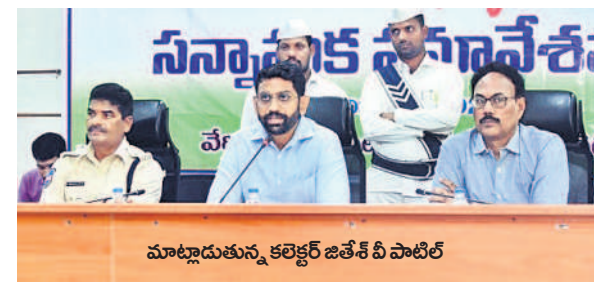
మాట్లాడుతున్న కలెక్టర్ జితేష్ వీ పాటిల్