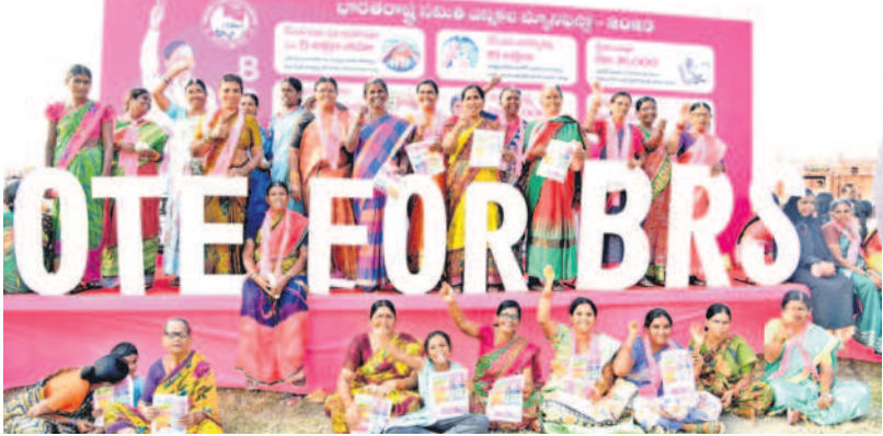
సభలో బీఆర్ఎస్ మ్యానిఫెస్టో స్టేజీ వద్ద నినాదాలు చేస్తున్న మహిళలు