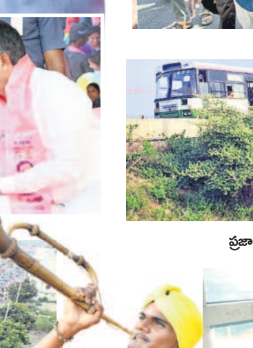
ప్రజాఅశీర్వాద సభకు వస్తున్న జనం