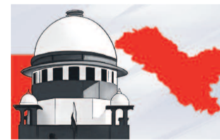
లద్దాఖేకు పూర్తిస్థాయిలో రాష్ట్ర చోదా కల్పించాలని వారు డిమాండ్ చేస్తున్నారు.

బీజేపీ ప్రభుత్వం 2019లో జమ్మికర్నీలకు ఉన్న ప్రత్యేక ప్రతిపత్తిని రద్దుచేసింది. బీజేపీ పార్లమెంటులో తనకున్న తిరుగులేని మెజారిటీతో ప్రజాభిప్రాయానికి విరుద్ధంగా ఆ రాష్ట్రాన్ని రెండు కేంద్రపాలిత ప్రాంతాలుగా విడదీసింది. ఇది జరిగి నాలుగేండ్లు గడిచినా బీజేపీ స్థానిక ప్రజల్లో విశ్వాసాన్ని పొందలేకపోయింది. ఇటీవల జరిగిన ఎన్నికల ఫలితాలను బట్టి చూస్తే స్థానికులకు బీజేపీపై ఇంకా ఆగ్రహం చల్లారలేదని స్పష్టంగా అర్థమవుతుంది.