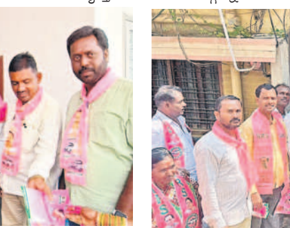
విలుకానగర్ డివిజన్లో ఇంటింటా ప్రచారం చేస్తున్న కార్పొరేటర్ గీత