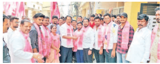
బీఆర్ఎస్లో సాఫ్ట్వేర్ ఇంజనీర్ల చేరిక

కమలం, టీడీపీ పెద్దలు పాత్తుకు ఉప్పొంగుతున్నట్లు కనిపిస్తున్నప్పటికీ.. ఆ పార్టీ క్యాడర్ మాత్రం పాత్తును అంగీకరించడంలేదు. ఒంటరిగా బరిలోకి దిగితేనే మేలు జరిగే అవకాశాలు ఉంటాయని ఆయా పార్టీల ద్వితీయ శ్రేణి నాయకులు, కార్యకర్తలు చెబుతున్నారు. అందులో భాగంగానే కమలం పెద్దలు పాత్తుపై తీవ్రంగా చర్యలు జరుపుతున్నట్లు సమాచారం. ఇప్పటికే దరఖాస్తు చేసుకున్న అభ్యర్థుల లిస్టును పక్కన పెట్టి మరోసారి సర్వే చేయిస్తున్నట్లు తెలుస్తున్నది. ఆ సర్వే ఫైనల్ అయ్యాక సీట్లు ఖరారు చేస్తారని, ఇప్పటికే కొత్తవారికి టీకెట్లు కేటాయింపు ద్వారా ఆశావహులు అధినాయకత్వానికి లేఖలు రాసినట్లు సమాచారం.