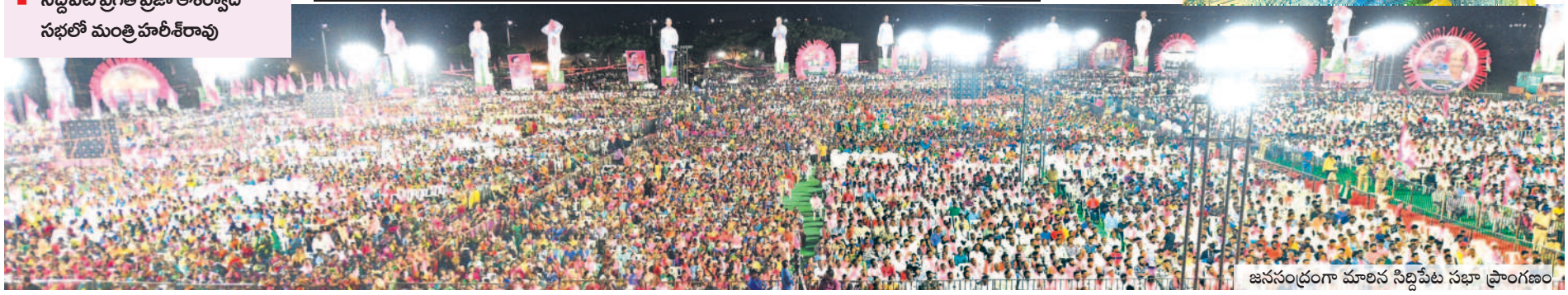
జనసంద్రంగా మారిన సిద్దిపేట సభా ప్రాంగణం